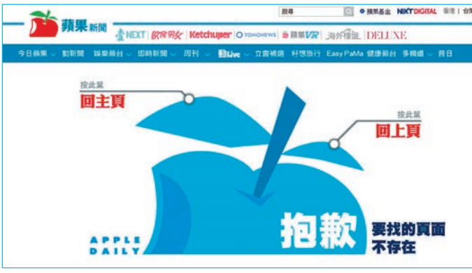
《蘋果》急棄「爛蘋果」，大佬喉舌求生慾果然強呀！ 網站截圖