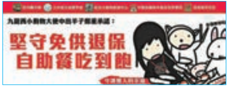
中出羊子標語潤小麗假大空。 fb圖片