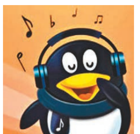
■ 騰訊音樂今年二季度月活用戶超過8億。元攀升至15.93億元;淨利潤則從0.85億元飆升至13.19億元。

據招股書顯示,騰訊音樂2018上半年營收為86億元(人民幣,下同),同比增長92.2%。騰訊音樂今年二季度月活用戶超過8億,二季度日活用戶平均用戶時長為70分鐘。2016年和2017年總營收分別為43.61億元和109.81億元,毛利潤分別為12.32億元和38.1億元,毛利率從28.3%提升至34.7%。經營利潤從1.03億