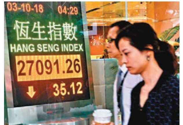
■ 港股昨在二萬七關反覆,一度跌近300點後曾倒升,成交只有677億元。

香港文匯報訊(記者 周紹基) 港股10月開局連跌兩日,昨在二萬七關反覆,隔夜美股雖然續創新高,但恒指昨日一度跌近300點,低見26,840點,中午又曾倒升逾140點,惟尾市未能保住成果,收市仍微跌35點報27,091點。由於27,000點大關一度跌穿,令共有114隻牛證被「打靶」。內地正值國慶黃金週假期,北水欠奉,大市交投淡靜,昨日全日成交不足700億元,只有677億元,為今年第三低。