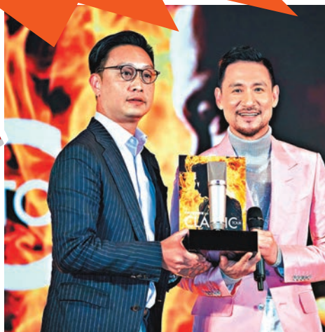
學友強調無想過封咪。

提到在內地巡唱時，學友被網友稱讚是「逃犯剋星」，多位通緝犯都因閃避而落網被捕。笑指學友成功瓦解犯罪集團時，