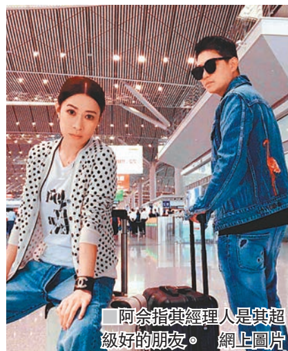
阿佘指其經理人是其超級好的朋友。

他說：「我們也沒理由要調查觀眾身份後才准入場，我們做表演的，誰來支持都歡迎，但每個人都要為自己做過的事負責，也相信香港是全世界最安全的地方之一。」