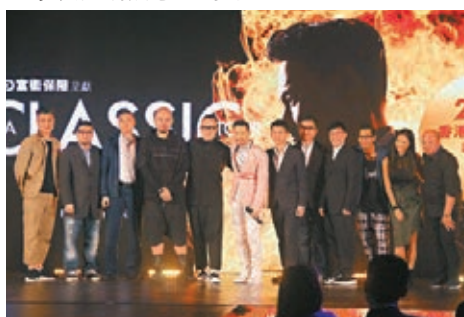
學友特別邀請一班幕後英雄上台。

他說：「我們也沒理由要調查觀眾身份後才准入場，我們做表演的，誰來支持都歡迎，但每個人都要為自己做過的事負責，也相信香港是全世界最安全的地方之一。」