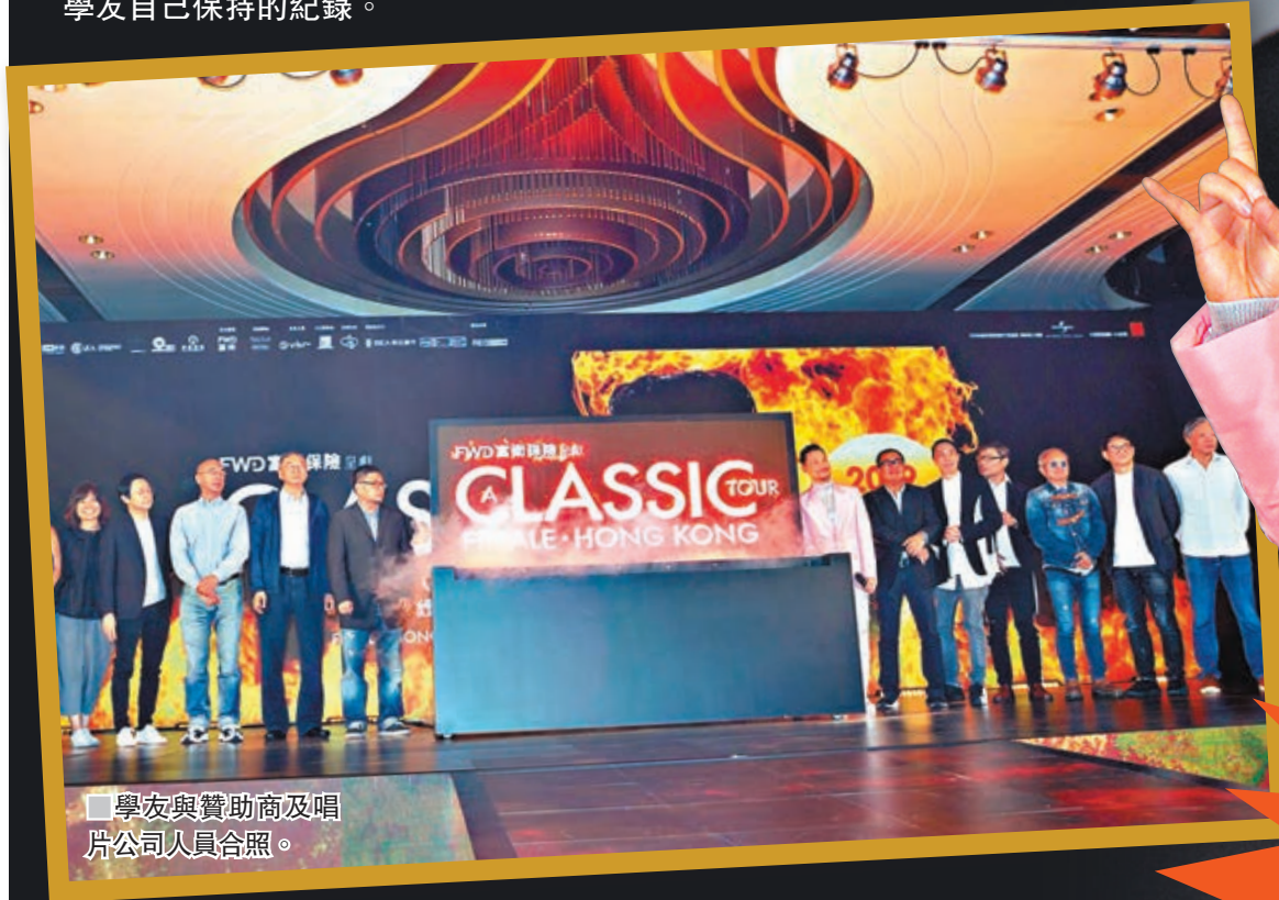
學友與贊助商及唱片公司人員合照。