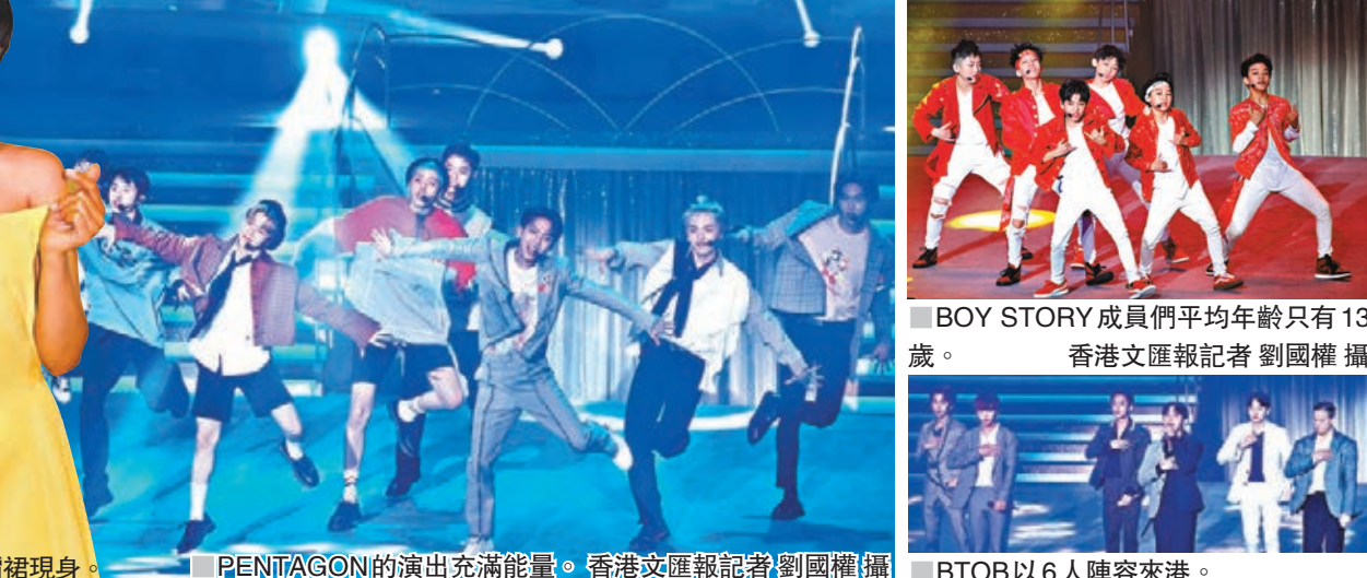
糖妹以黃色露肩裙現身。