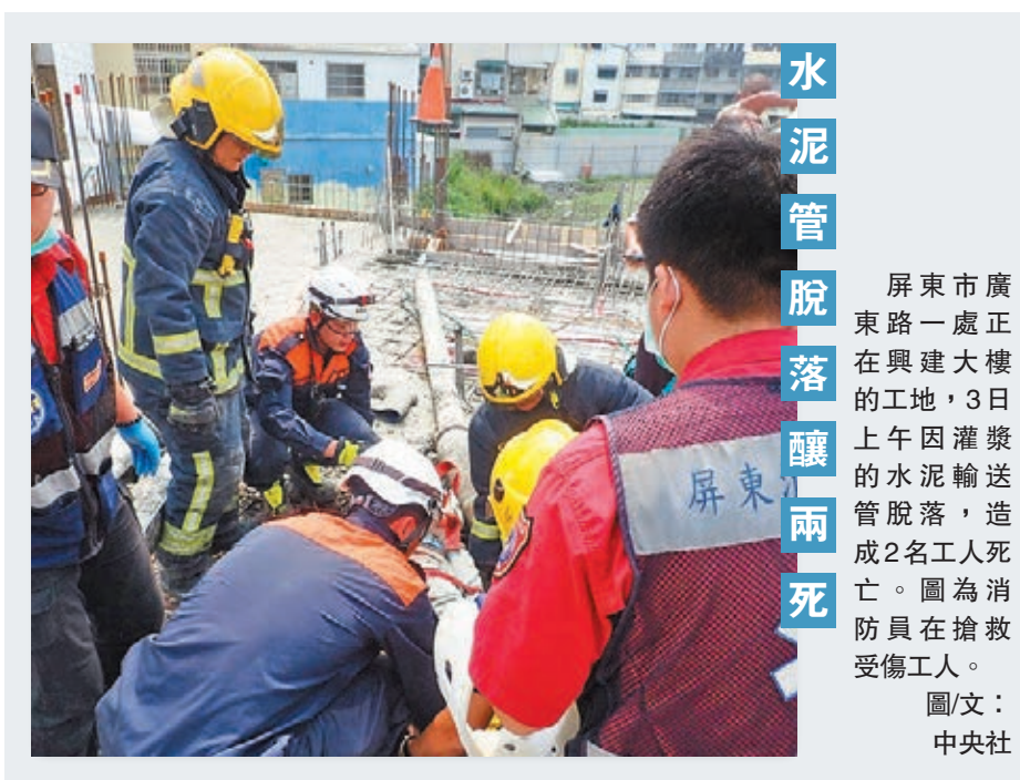
水泥管脫落釀兩死

隨後，馬英九一行入中轉往嘉義市。在嘉義縣民眾服務社負責人安排下，與工商後援會成員餐敘。馬英九指出，綠黨執政縣市賣水果到大陸碰壁，這是客觀情勢問題。若民進黨繼續執政，民眾會更苦。