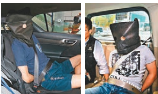
箭盾行動共拘10人。

另一方面，探員根據資料在中區一間銀行內拘捕兩名目標男子，其中一人正在申請貸款，當場檢獲兩張不屬於他們的身份證及一批貸款申請文件，包括稅務文件、銀行月結單等。初步調查，其中一人涉嫌盜取一名商人的身份證及銀行月結單等文件，先後向四間銀行申請共365萬元貸款，當中三間銀行共265萬元貸款已經批出，幸警方及時將