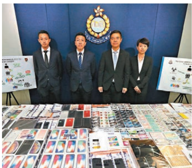
偷卡呢借貸涉款逾775萬。