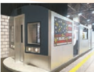
入口處化身成地鐵站。

加上，迷宮內還有三個互動遊戲裝置，以供參觀者從各感官來欣賞 Keith Haring 的著名畫作。在迷宮外，還有多個立體雕塑供大家打卡拍照。當大家走畢迷宮後，你還可登上高達 3 米的天橋，於高空鳥瞰整個迷宮。而現場在出口處更設有紀念品售賣區，所有紀念品均由澳門本地設計師構思，結合 Keith Haring 的畫作推出多款限定精品，以供大家留念。