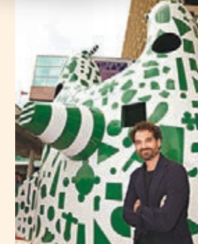
著名西班牙鬼才設計師 Jaime Hayon 早前來港出席個人展覽開幕儀式。