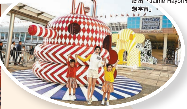
於海運大廈露天廣場展出「Jaime Hayon 奇幻宇宙」。