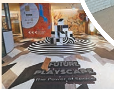
這個裝置驟眼望好像立體的。