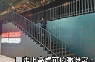
走上高處可俯瞰迷宮。