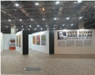
進入展館後，可先看 Keith Haring 的藝術創意背景，然後沿外圍逐一欣賞其畫作。