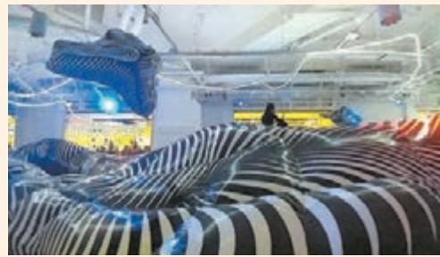
樂園糅合實用性高的建築學與充滿美感的设计元素。