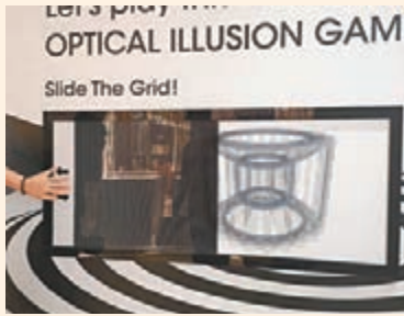
左右移動，會出現不同畫面，如動感般。