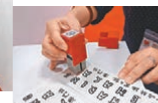
儲齊 20 個印章可換取明信片乙張。