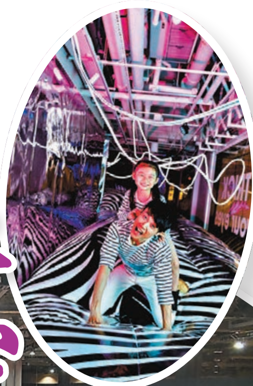
chi K11 藝術空間化身遊藝樂園「FUTURE PLAYSCAPE: The Power of Space」。