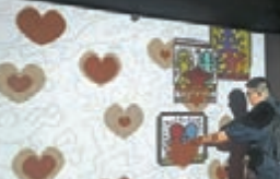
迷宮內第三個互動裝置：只要輕按心心，畫作便會出現，然後慢慢向上升。