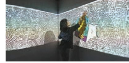
迷宮內第一個互動裝置：以手在螢幕上慢慢地掃，畫作便會呈現眼前。