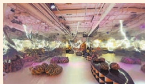
chi K11 藝術空間入口。