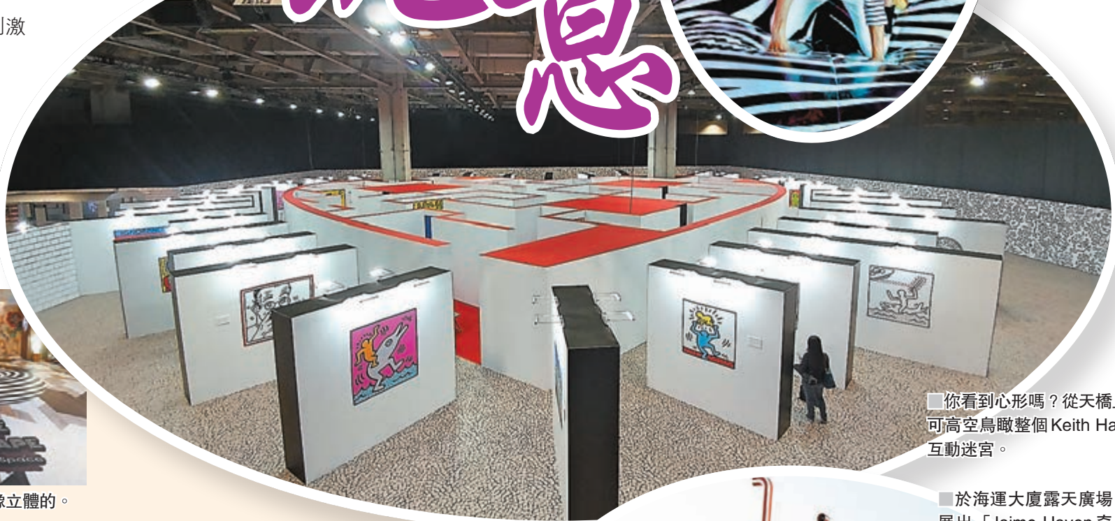
你看到心形嗎？從天橋上，可高空鳥瞰整個 Keith Haring 互動迷宮。