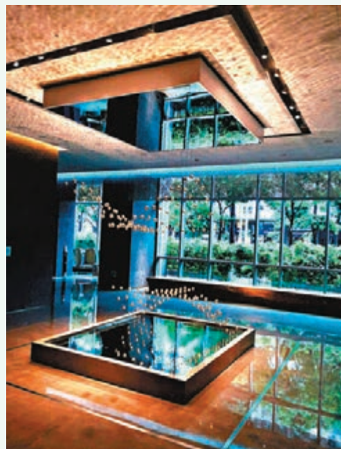
在酒店 28 樓雲垂樓入口擺放了由知名冰島裔丹麥藝術家奧拉佛·艾里亞森以自然環境元素為題的雕塑作品「月相 2016」。