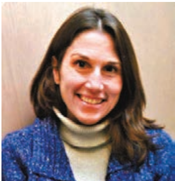
拉米雷斯通過律師表示，已同意與FBI合作，協助調查卡瓦諾的性侵指控。

特朗普前日於西弗吉尼亞州出席拉票活動，他於2016年大選時於該州得票42%，在當地大受歡迎。特朗普於集會上多次抨擊民主黨為奪回權力不擇手段，從卡瓦諾事件可見一斑，呼籲支持者以選票表態。