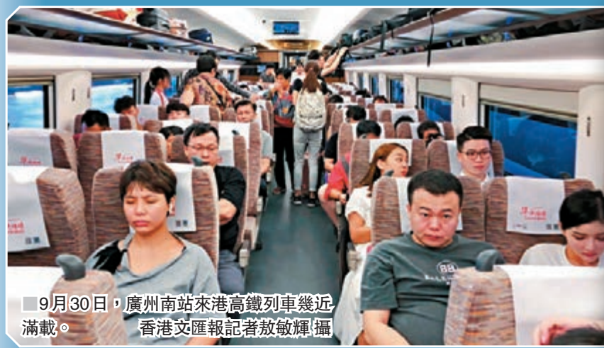
9月30日，廣州南站來港高鐵路車幾近滿載。