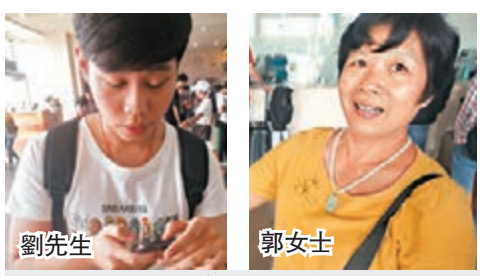
劉先生 郭女士

香港文匯報記者從廣州南站獲悉，國慶黃金周搭高鐵路來港旅遊大熱。該站昨日發往西九龍的列車基本滿載，10月1日車票更為緊張，早在兩天前已銷售一空。