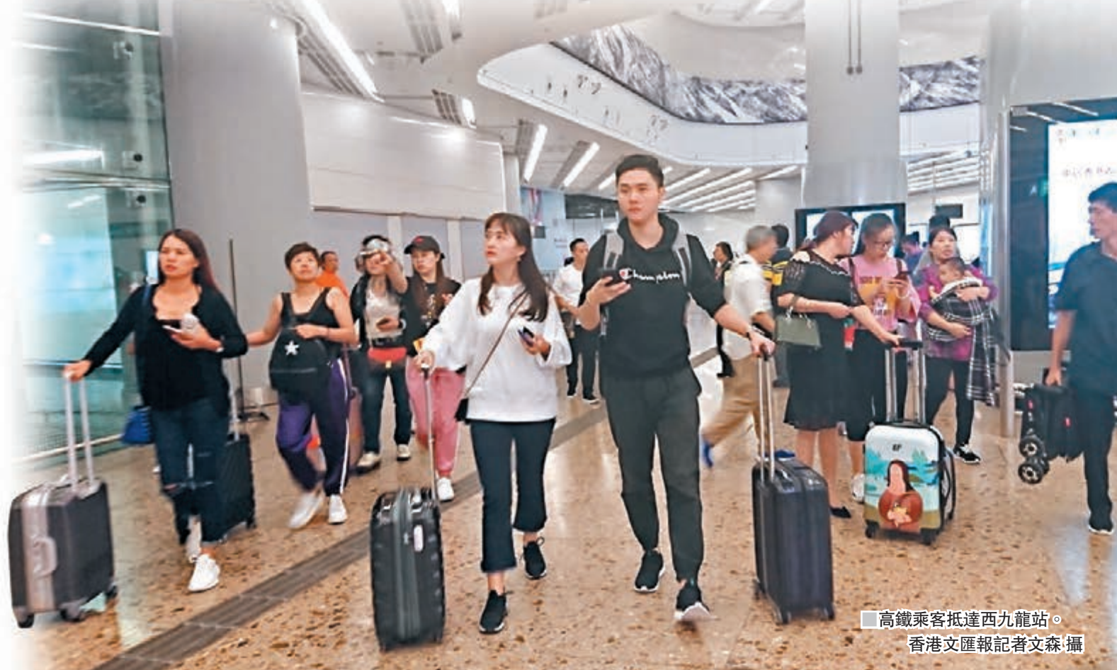
高鐵路客抵達西九龍站。

來自廣州的小姐首次乘高鐵到香港，指今次行程目的主要為探望親戚，並順道帶女兒到迪士尼樂園遊玩，「以前試過乘和諧號到深圳再轉車，亦有坐過直通車到紅磡，但都不夠直接乘高鐵方便。」