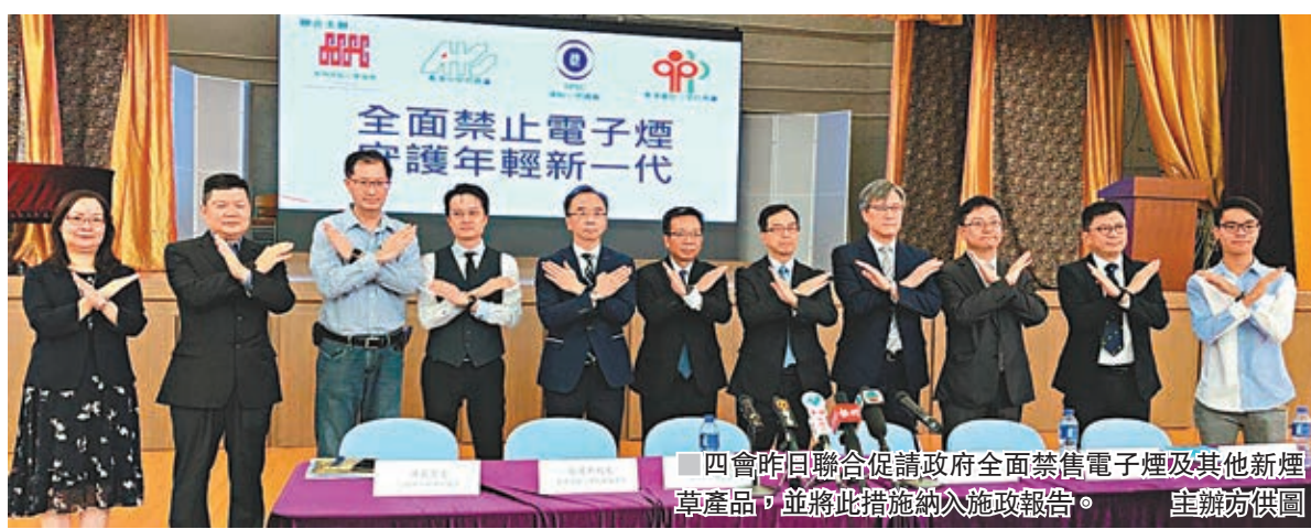
四會昨日聯合促請政府全面禁售電子煙及其他新煙草產品，並將此措施納入施政報告。

香港文匯報訊(記者 柴靖)香港四個最主要的小學議會及校長會昨日罕有地聯成一線舉行記者會，促請特區政府全面禁售電子煙及其他新煙草產品，並將此措施納入施政報告，以守護年輕新一代健康。有關意見並得到全港18區家長教師會聯會及家校會支持。四會認為，電子煙已被宣傳為口味不同、外形千變萬化的潮流玩意，明顯針對青少年及兒童市場，是莫大威脅。有戒煙輔導員指出，近年電子煙煙民正明顯增加，最年輕的個案只得10歲，因快速上癮兩個月後便要轉吸傳統煙。