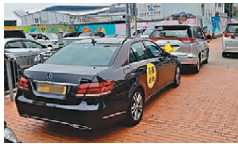
網民踢爆小麗老千架Benz鏟上行人路，未選到就已經咁大官威囉?

既然小麗老千都出動到Benz造勢咁豪華，就唔好咁度縮連泊車費都慳啦!不過講係咁講，其實小麗老千連自己拖選舉承諾嘅「捐半份糧」都可以拖得就拖，拖到要選補選先至嘔返出嚟塞住人哋把口，佢又有咩唔慳得呢?