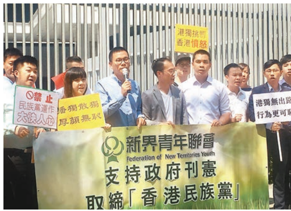
新界青年聯會到政總請願，促取締其他「獨」組織。

香港文匯報訊(記者 鄭治祖)「港獨」荼毒青年，社會齊聲譴責。新界青年聯會昨日請願，支持特區政府依法取締「港獨」組織「香港民族黨」，並促請當局以嚴正、強硬的態度依法取締其他「港獨」組織。有出席青年強