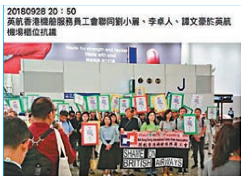
老千今次唔「企街」改去企機場。