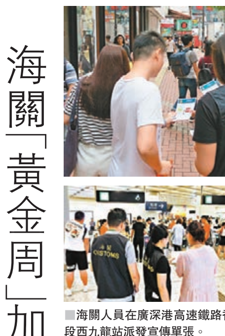
▲海關展開「極光」行動。圖示海關人員在銅鑼灣派發宣傳單張。

該負責人指出,為滿足國慶期間旅客出行需求,廣鐵集團採用動車重聯、開行周末線、高峰線及加開列車等方式,計劃加開高鐵列車104趟。