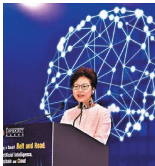
▲林鄭月娥指,香港成為仲裁中心,正是由於港擁有獨立的司法制度及法治精神。

香港文匯報訊(記者 鄭治祖)加拿大菲沙研究所日前發表的《世界經濟自由度2018年度報告》中稱,憂慮香港受到中國內地的「干預」,會導致香港的法治優勢倒退。特區政府隨即發表聲明,強調並沒有客觀事實證明香港的法治或司法獨立受到任何干預。特首林鄭月娥昨日也指,香港成為法律和爭議解決服務中心,亦被視為首選的仲裁地之一,正是由於香港擁有獨立的司法制度及法治精神。