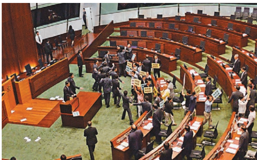
當日立會「掙杯」現場一片混亂。資料圖片