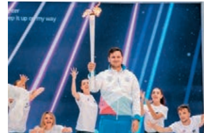
大冬會聖火傳遞儀式昨日在哈爾濱舉行。

本屆大冬會將於2019年3月2日至3月12日在俄羅斯克拉斯諾亞爾斯克舉行，預計將有50多個國家和地區的5000餘名運動員及官員參加。中國代表團將派出近200人的隊伍，參加花樣滑冰、短道速滑、高山滑雪、單板滑雪、男子冰壺、女子冰壺等10個項目的角逐。