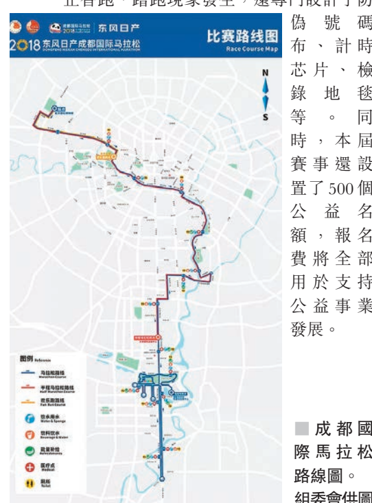
成都國際馬拉松路線圖。

香港文匯報訊(記者李兵成都報道)2018成都國際馬拉松組委會表示，此賽事將於10月27日在成都舉行，比賽項目有馬拉松(42.195公里)、半程馬拉松(21.0975公里)和歡樂跑(約5公里)。截至目前，共有50294名選手註冊報名。男女選手的比例分別為59.73%、40.27%，20至34歲年齡段的跑者人數最多，佔比達61.78%，最年長者80歲；共有52個國家和地區的跑友報名參賽。賽道起點設在了金沙遺址博物館，途經琴台路、合江亭、安順廊橋、九眼橋、四川大學、望江樓公園、東湖公園、天府國際金融中心、成都演藝中心、環球中心、中國-歐洲中心、天府綠道桂溪生態公園、世紀城新國際會展中心等諸多成都地標。為提升廣大跑者的賽事體驗，在沿途設置了23個補給站、26個音樂加油站。為防止替跑、蹭跑現象發生，還專門設計了防偽號碼布、計時芯片、檢錄地毯等。同時，本屆賽事還設置了500個公益名額，報名費將全部用於支持公益事業發展。