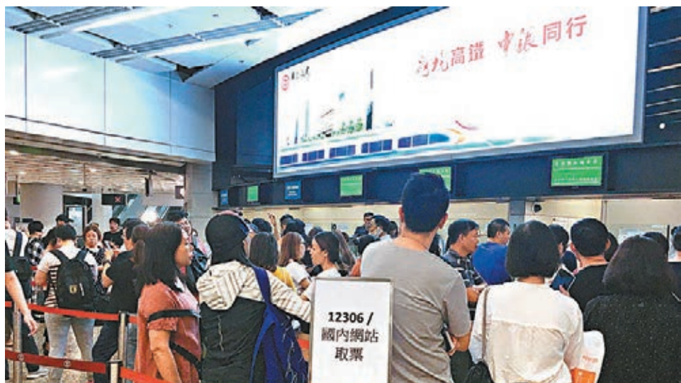
處理「12306」網站票務的櫃位仍排長龍。

他形容問題刻不容緩，需從源頭改善，故會盡快採取兩項改善措施，包括在站內B1層加裝自助取票機，以及將7個處理這些票務的櫃位再「加碼」，更靈活地滿足乘客需