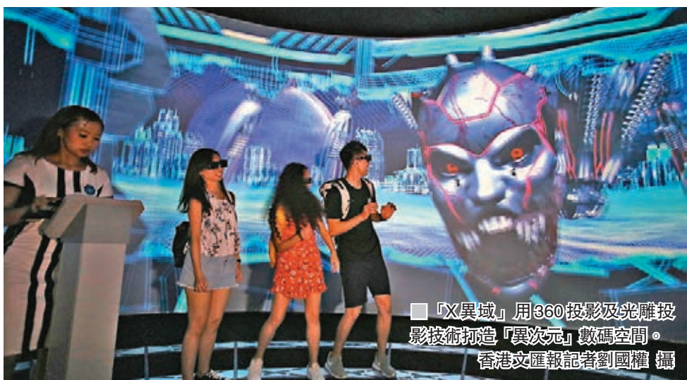
「X異域」用360度投影及光雕攝影技術打造「異次元」數碼空間。

香港文匯報訊（記者 楊佩韻）海洋公園哈囉喂全日祭於10月5日至31日期間16個指定日子舉行，今年主打高科技等多媒體互動元素，如「X異域」利用5個投影機及10個電腦營造360度「異次元」的數碼空間，及後遊人會進入光影交錯的迷宮尋找出路。