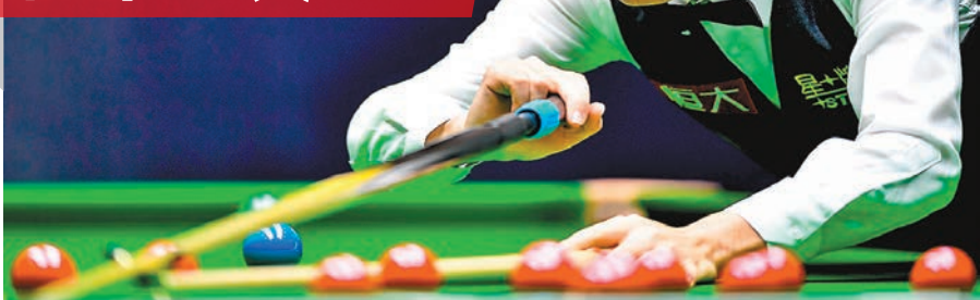
丁俊暉擊敗威爾斯選手李獲加，晉級正賽。

2018世界桌球中國錦標賽(中錦賽)昨在廣州天河體育中心全面打響，中國「一哥」丁俊暉繼在前晚資格賽以5:3擊敗威爾斯選手李獲加、首戰告捷後，昨在首輪正賽再迎戰另一名威爾斯球手丹尼威爾斯。比賽中丁俊暉打出一桿破百和兩桿50+，連續三局零封對手，以總局數5:1大勝晉級。丁俊暉今日將在第二輪比賽與袁思俊進行「打吡戰」。