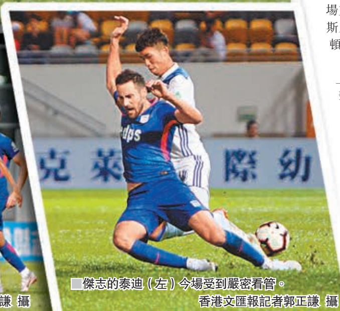
傑志的泰迪(左)今場受到嚴密看管。