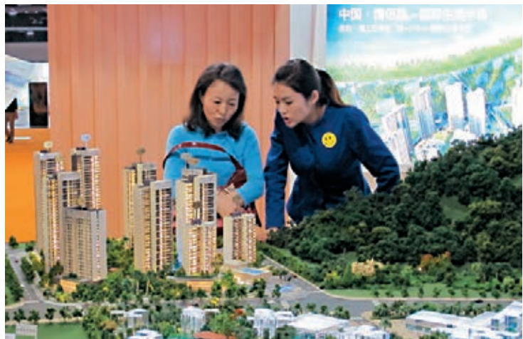
■上週五市傳指廣東擬取消樓市預售，全面實施現售。資料圖片

香港文匯報訊（記者 岑健樂）受到上週五市傳指廣東擬取消樓市預售制消息影響，昨日內房股全線下挫，當中碧桂園（2007）大跌5.57%，收報10.84港元，是昨日表現最差藍籌股。上週五路透社引述消息人士稱，國家住