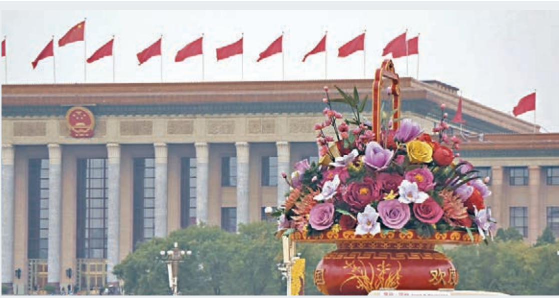
標普發表報告指出，未來3年至4年中國經濟將保持強勁增長，實際人均GDP年增長率仍將保持在5%以上。

標普發表報告指出，未來三到四年中國將保持強勁的總體GDP增速和獲得改善的財政表現。預計在公共投資增長進一步減速的背景下，實際人均GDP年增長率仍將保持在5%以上。加強控制地方政府預算外債務，預計也會使財政赤字呈現下降趨勢（以廣義政府債務對GDP比率的變化來衡量）。