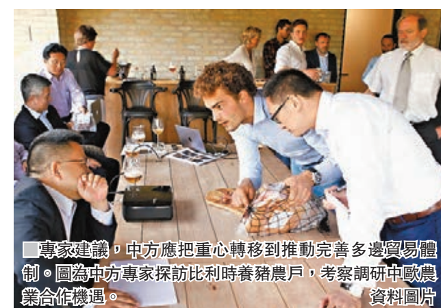
專家建議，中方應把重心轉移到推動完善多邊貿易體制。圖為中方專家訪比利時養豬農戶，考察研訂中歐農業合作機遇。