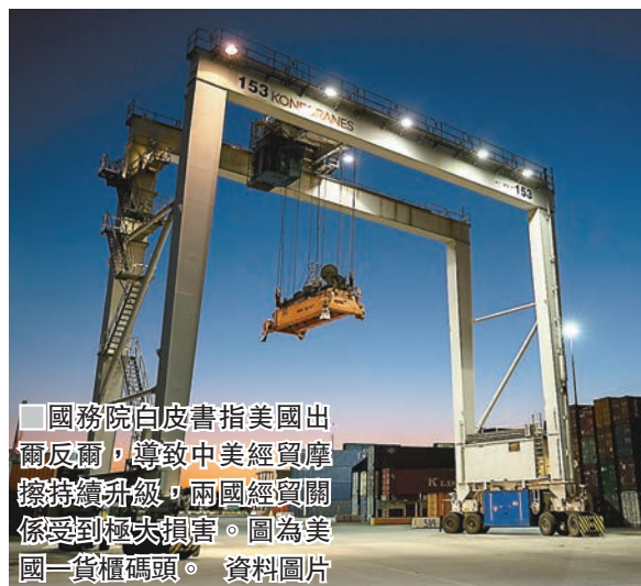
國務院白皮書指美國出爾反爾，導致中美經貿關係受到極大損害。圖為美國一貨櫃碼頭。資料圖片

此外，陳鳳英認為，鑒於特朗普經常反覆無常、言而無信，中方沒有必要再把過多的精力放在談判上，加緊研究如何應對貿易戰帶來的衝擊反而更加務實。這其中，要處理好跨國公司的問題，把跨國公司留下來，特朗普貿易戰的如意算盤也就落空了一半。