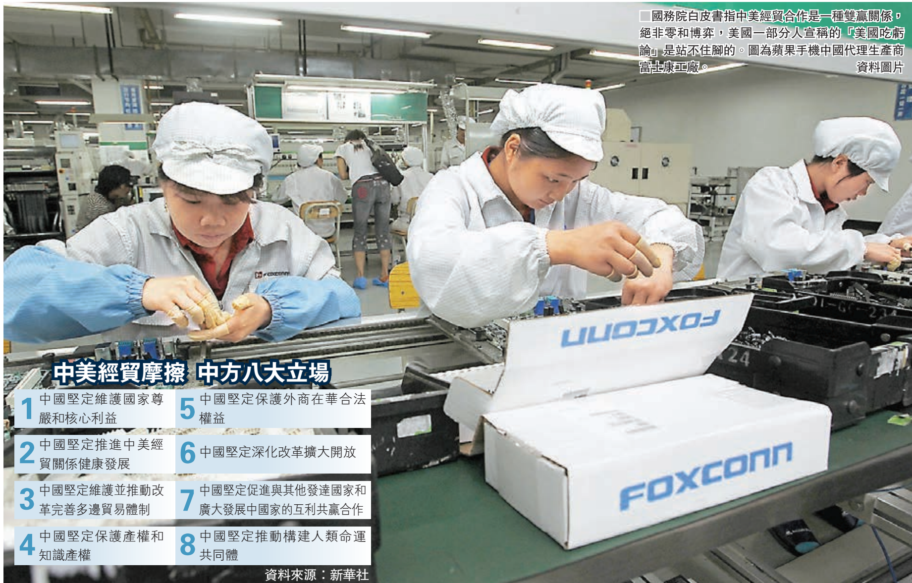
國務院白皮書指中美經貿合作是一種雙贏關係，絕非零和博弈，美國一部分人宣稱的「美國吃虧論」是站不住腳的。圖為蘋果手機中國代理生產商富士康工廠。

對於貿易戰，中國不願打、不怕打、必要時不得不打。中國談判的大門一直敞開，但談判必須以相互尊重、相互平等和言而有信為前提，不能以犧牲中國發展權為代價。