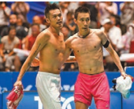
李宗偉(右)與林丹的「瑜亮之爭」成為一個時代的佳話。資料圖片