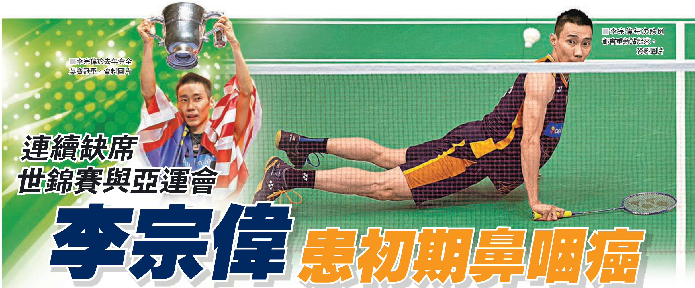
李宗偉每次跌倒都會重新站起來。資料圖片