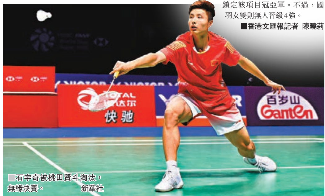
石宇奇被桃田賢斗淘汰，無緣決賽。