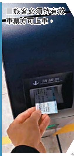
旅客必須持有有效車票方可上車。

根據《廣深港高速鐵路跨境旅客運輸組織規則》，旅客需遵守乘車條件，包括必須持有有效車票並按票面載明的日期、車次、席別乘車；車票當日常次有效。旅客進出車站及乘車時應接受站車工作人員驗票，進站時亦需接受車站安全檢查。