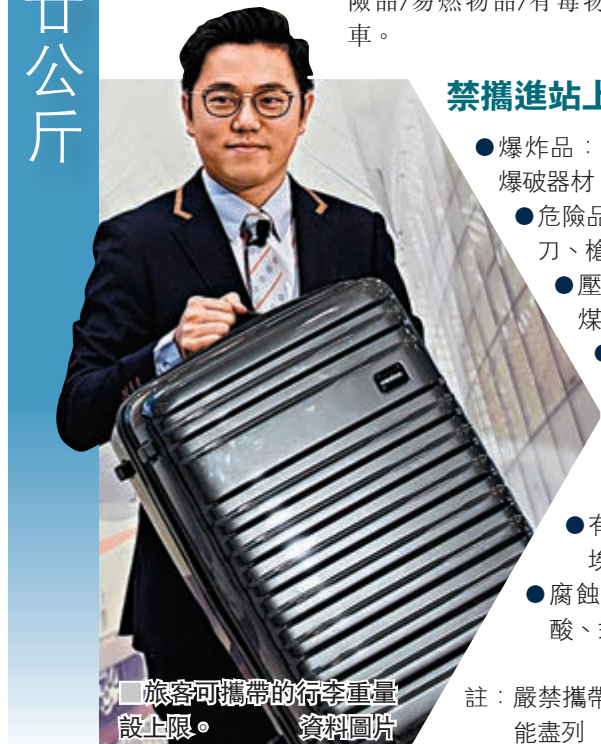
旅客可攜帶的行李重量設上限。資料圖片