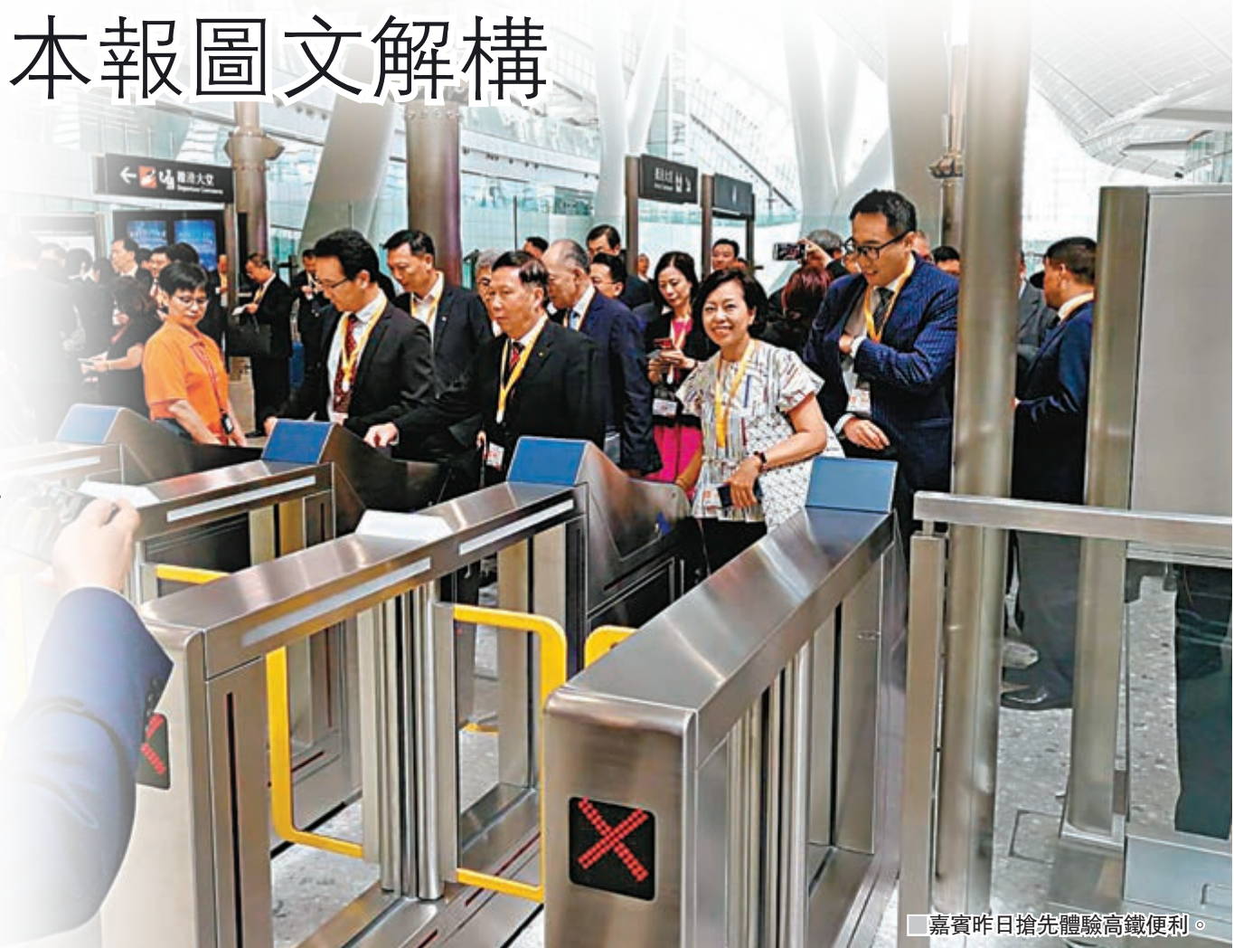
嘉賓昨日搶先體驗高鐵路車。