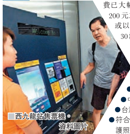
西九龍站售票櫃。資料圖片

提供有關服務涉及一定成本，經政府、港鐵及鐵總商討後，乘客於這5個售票窗口購買內地段車票的手續費已大幅下調。票價人民幣200元以下，200元或以上至300元以下，以及300元以上，服務費分別為10元、20元及30港元。