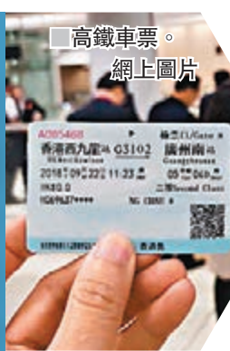
高鐵路車。

高鐵路車分為成人票及小童票，成人票適用於年滿18歲或身高1.5米以上旅客；小童票適用於未滿18歲及身高1.2米至1.5米旅客。另設異地就讀學生票，在內地就讀合資格學校的香港學生，每年可享4張車票七五折。