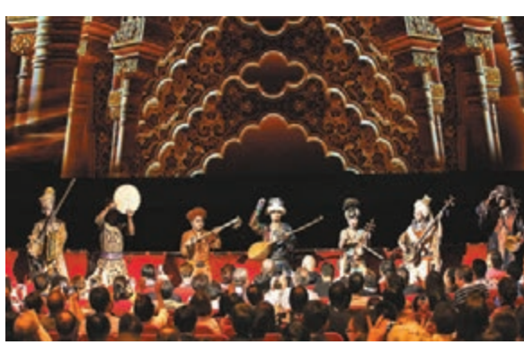
■劇中選用大量民族樂器。