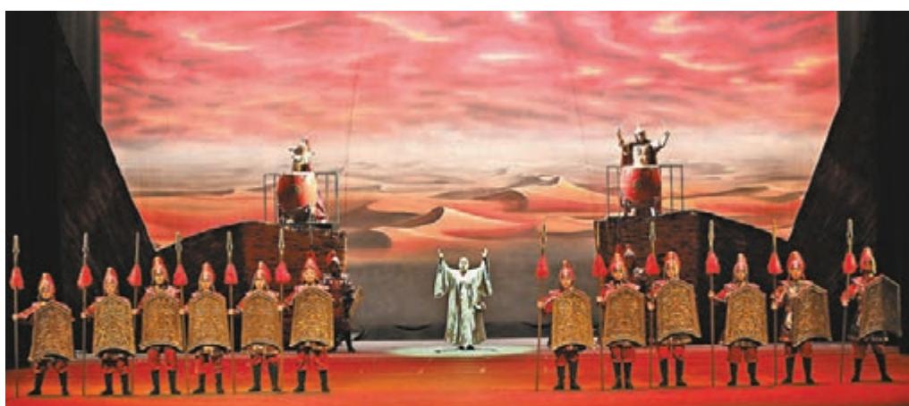
■中央民族樂團精彩絕倫的演出,為香港市民帶來美的視覺盛宴和心靈震撼。