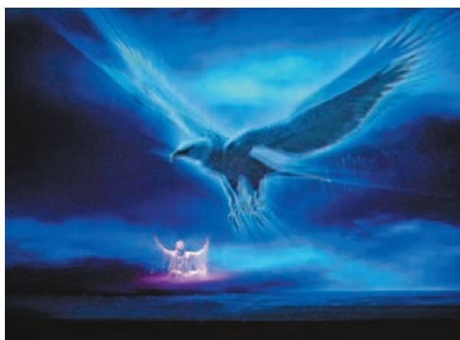
■音樂劇再現玄奘取西經的經歷點滴。

段部分,特別是第八首曲目《高昌》,曲目甫開始,數名的演奏家手持樂器和劇中的玄奘法師,到台下與觀眾近距離演奏表演,當中的樂器更是維吾爾族、哈薩克族的樂器,包括艾捷克、熱瓦甫、冬不拉、庫布孜、薩塔爾等。