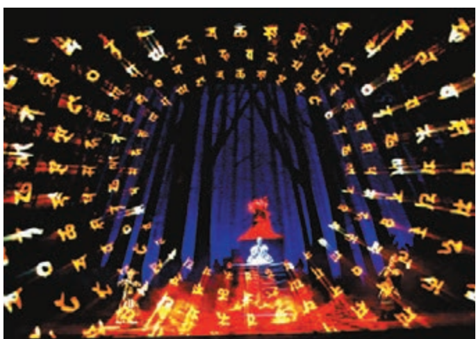
■節目讓人眼前一亮,深具佛教底蘊及意境。