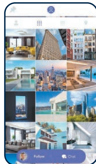
按入經紀頭像可瀏覽其曾上載的其他放盤。