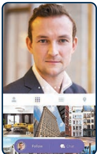
Real Messenger 登陸本港前，已於美國運行了兩個多月。

其實，「Real」在本文見報時，亦已經於本港運行，目前程式介面為英文，但地產經紀於 App 中可以使用中文寫簡介或溝通。