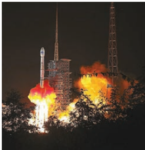
兩顆北斗衛星前日在西昌衛星發射中心成功發射。