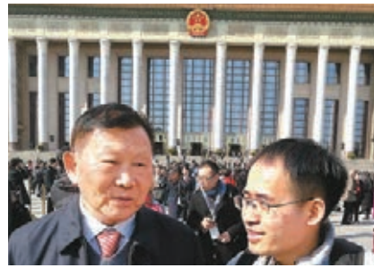
2017年全國兩會,王夢恕(左)接受香港文匯報採訪。

王夢恕曾擔任兩屆全國政協委員、三屆全國人大代表,給媒體留下「直言」、「敢言」的印象。特別是作為鐵路專家,對於有關鐵路方面的採訪更是來者不拒,是媒體口中的「採訪友好型」明星院士。近兩年,令人印象最深刻的是,對於此前「因為包給企業,高鐵盒飯40多塊錢一份」的情況,他直接回應稱,該做法在「丟高