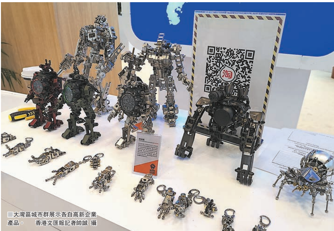
大灣區城市群展示各自高新企業產品。

對於廣東省內的「天河二號」超算中心、散裂中子源等大科學裝置,陳冠華坦言,對香港科研團隊提供了很大幫助,並希望香港政府今後在科研經費方面能夠不斷加大投入。