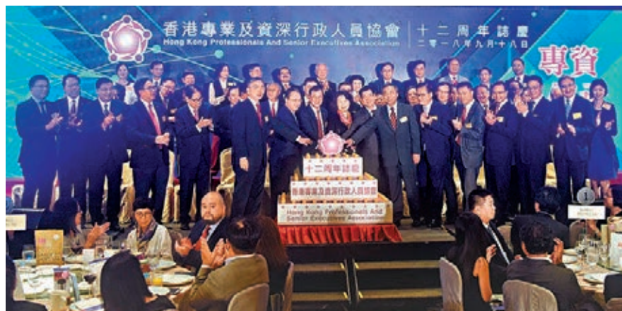
賓主一同主持切蛋糕儀式,慶祝專資會成立12周年。

香港文匯報訊(記者 李擘)香港專業及資深行政人員協會(專資會)日前慶祝成立12周年誌慶晚宴,律政司司長鄭若驊、中聯辦副主任譚鐵牛、外交部駐港副特派員楊義瑞出席主禮,會長李鏡波等陪同。各界嘉賓友好約400人歡聚一堂,共度喜悅時刻。