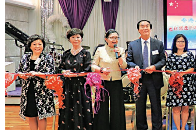
持香港長期繁榮穩定作出更大貢獻。

李家超又談到此次由其率領的香港紀律部隊文化交流團全體成員在北京受到了國務院副總理韓正的热情會見。韓正副總理對於紀律部隊的工作給予了充分的肯定,並且希望紀律部隊能夠全面準確理解和貫徹「一國兩制」方針,堅定有效地維護國家安全,維護香港法治,為廣大市民提供優質服務,積極促進香港與內地的有關交流合作向縱深發展。李家超在現場表示香港紀律部隊在今後也一定會繼續依法履職盡責,為維護國家主權、安全和發展利益,保