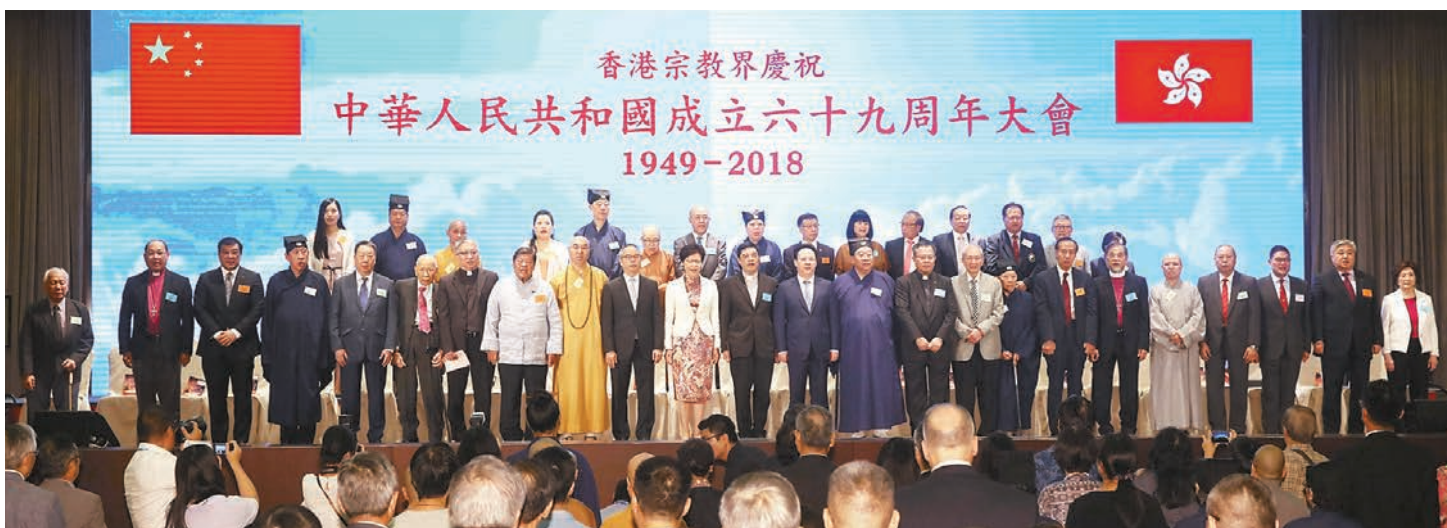
香港宗教界慶祝中華人民共和國成立69周年大會,賓主合影。