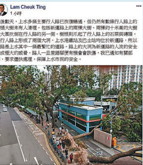
電話廷fb只見一張「靜物照」,其本人仍舊不露面。