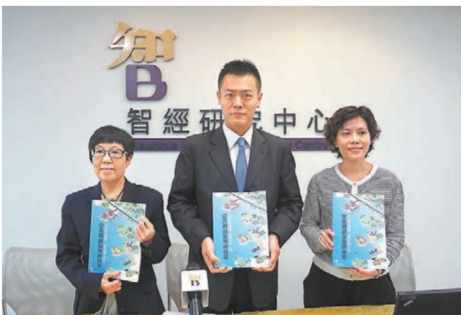
智經研究中心建議「早搬多價津貼計劃」,向受徵地影響的合資格人士提供補償金額5%至10%的額外搬遷津貼,增加誘因加快收地。

中心並建議以「20分鐘社區生活圈」規劃設施佈局,讓市民能於20分鐘的步行距離內,使用不同的公共設施和社區服務,締造宜行和易達的宜居城市。