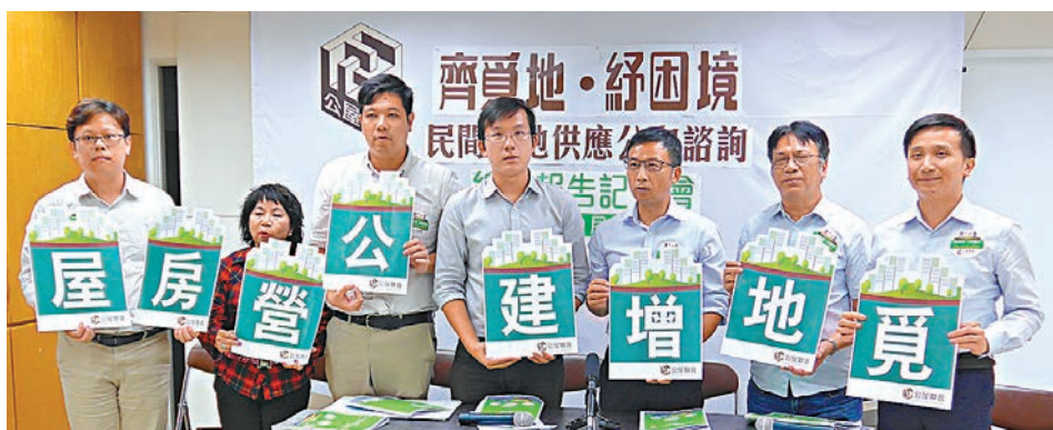
公屋聯會就10項短中長期土地供應方案建議作調查。

餘下建議包括收回粉嶺高爾夫球場(69.7%)、在社區設施上蓋起屋(68%)、郊野公園邊陲興建公營房屋(67.9%)及收回「棕地」建屋(64.6%)。至於發展「地下城」以增加可用面積、利用臨時土地興建過渡性