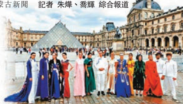
外國模特穿著內蒙古服飾在盧浮宮前合影。

將傳統蒙古族服飾的設計理念和基本元素呈現在觀眾眼前。在內蒙古鑲黃旗珠拉的作品中,則能看到兼具傳承與時尚的民族現代生活裝。■香港文匯報記者 朱燁、喬輝 綜合報導