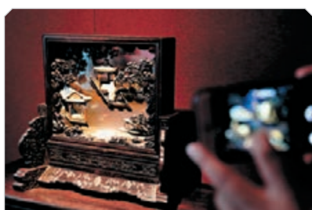
清中期紫檀嵌珠琅玉石樓閣人物圖插屏。中新社