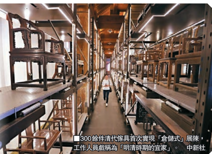
300餘件清代傢具首次實現「倉儲式」展陳,工作人員戲稱為「明清時期的宜家」。

故宮博物院昨日新增一大專題常設展館——位於紫禁城西南角的南大庫變身傢具館,一期展廳正式對外開放,首批300多件精品通過「倉儲式」展陳盡顯康雍乾三朝傢具之美。參觀者除了可以近距離觀賞這些傢具珍品外,還可通過手機掃碼,了解更多文物背後的故事。未來,三期全部佈展完成後,將有2,000件明清傢具與觀眾見面。■香港文匯報記者 王鑫嫻 北京報導