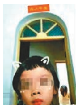
小女孩錄製短視頻卻意外曝光媽媽洗澡畫面。

近一年來,網絡短視頻火爆,青少年對其的熱情,有超過網絡遊戲之勢。昨日,在廣州舉行的2018年兒童互聯網大會上,一份由全國80多名少年兒童完成的《2018年中國兒童網絡安全調查報告》顯示,刷短視頻已經成為小學到初中過半學生的日常生活。而在所有受訪學生中,看過色情、欺凌、詐騙等不良信息的,比例超過60%,其中,西安學生比例甚至高達90%。專家表示,短視頻火爆的同時,也給少年兒童網絡安全帶來隱患,平台