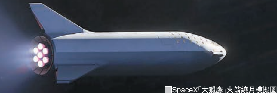
SpaceX「大獵鷹」火箭繞月模擬圖

美國太空科技公司SpaceX上週表示，將於明年接載首名旅客環繞月球飛行。SpaceX創辦人馬斯克前日召開發佈會，宣佈該名旅客是日本時裝網購平台Zozo創辦人、現年42歲的富商前澤友作，他將乘搭「大獵鷹」火箭繞月飛行一周，但預計2023年才能成行。