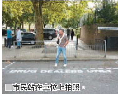
市民站在車位上拍照。

圖令警方尷尬。警方表示得悉情況，已全力打擊毒販。當地市議會表示明白居民的困擾，指問題源於太少警員巡邏，主要由於政府削減開支，導致市內減少逾200名警員。