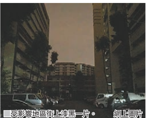
受影響地區街上漆黑一片。