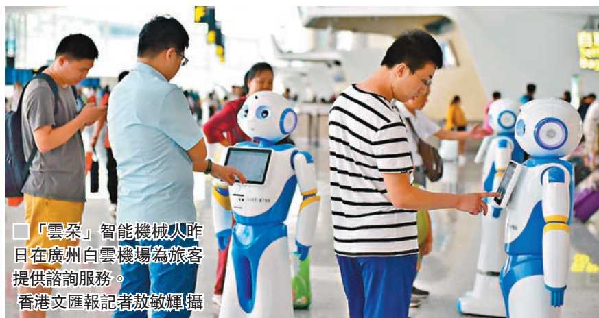
■「雲朵」智能機械人昨日在廣州白雲機場為旅客提供諮詢服務。

香港文匯報訊（記者 敖敏輝 廣州報道）廣州昨日舉行2018世界航線發展大會。廣州白雲機場會上宣佈，人工智能（AI）產品「雲朵」智能問詢機械人正式在T2新航站樓投入使用，透過大數據和雲計算技術，可為來自世界各地的旅客提供乘機諮詢、語音交互、定位導航、互動娛樂等多項智能化和個性化的服務。據悉，未來5年，白雲機場在智慧機場建設上系統投入，例如，今後可做到為每位旅客建立一個信息數據庫並作為唯一身份標識，旅客可在機場的各個環節實現身份識別，享受機場的便捷服務。