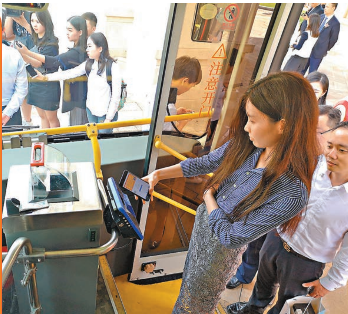
▲深圳昨日開通銀行卡搭巴士，市民體驗手機刷卡乘車。