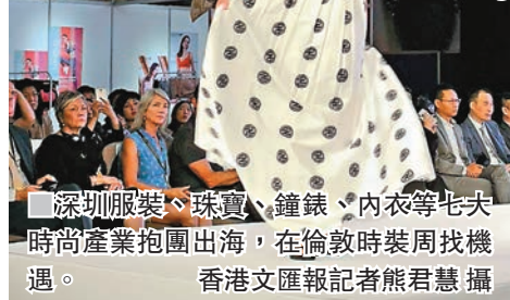
■深圳服裝、珠寶、鐘錶、內衣等七大時尚產業抱團出海，在倫敦時裝周找機遇。

香港文匯報訊（記者 熊君慧 倫敦報道）中美貿易戰愈演愈烈，中國製造業深受影響。如何在貿易戰危機中逆境求生，中國製造業企業紛紛主動出擊尋找機遇。深圳服裝、珠寶、鐘錶、內衣等七大時尚產業抱團出海，當地時間17日亮相英國倫敦時裝周。深圳市國際貿易促進委員會副主任郭經緯表示，順應科技升級消費升級的趨勢，深圳傳統優勢品牌正在加速拓展國內外市場，