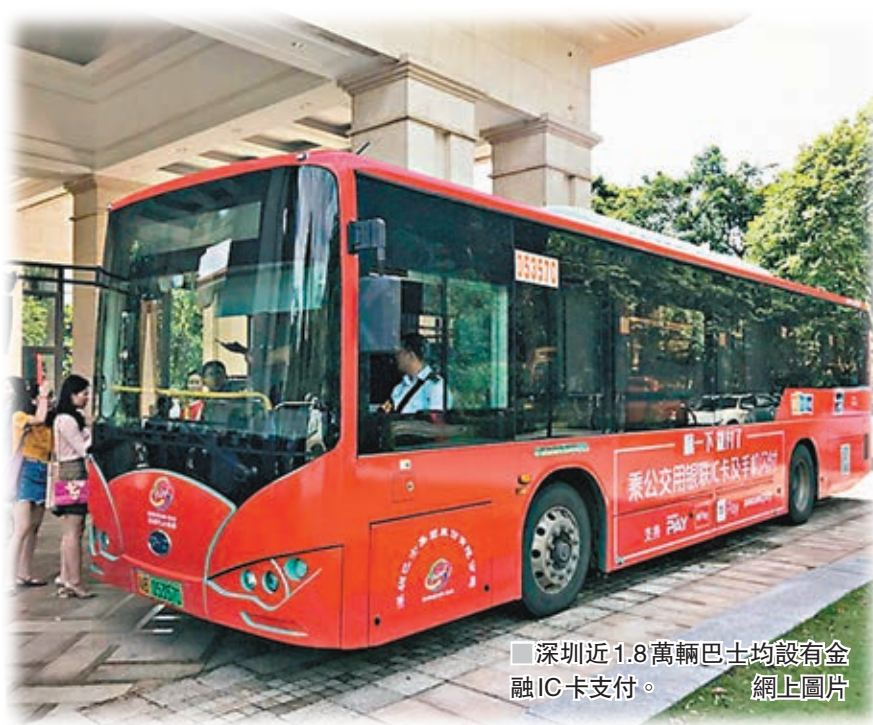
■深圳近1.8萬輛巴士均設有金融IC卡支付。