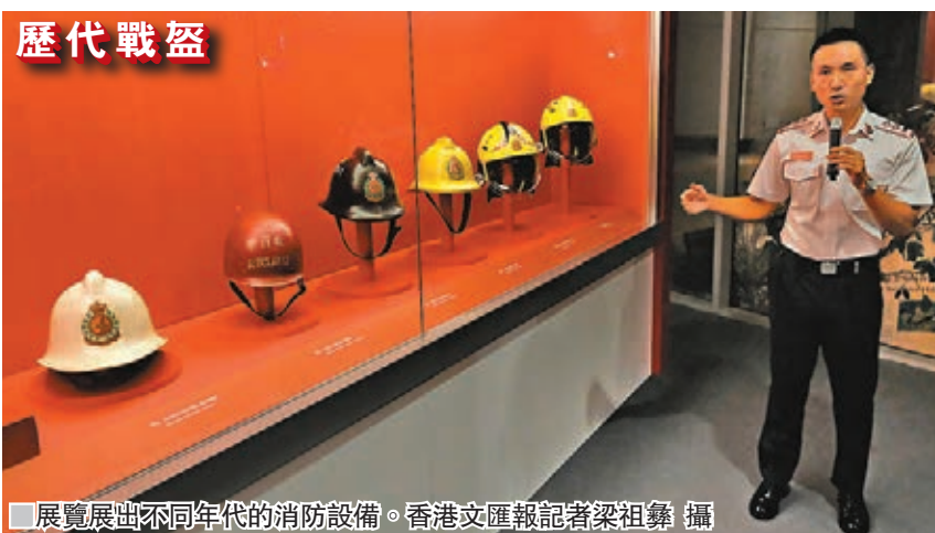
展覽展出不同年代的消防設備。