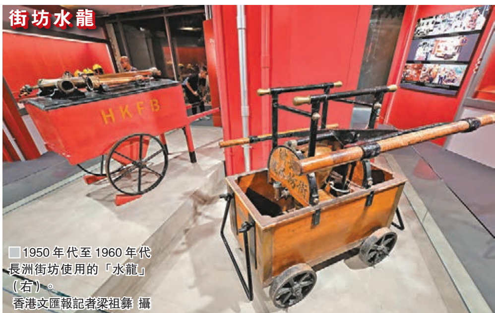
1950年代至1960年代長洲街坊使用的「水龍」(右)。

香港文匯報訊(記者 岑志剛) 今年是香港消防服務成立150周年，消防處聯同歷史博物館舉行「守護同行——消防服務150周年」展覽，展出早期的消防設備和工具，包括木製消防車、街坊水龍和行動頭盔，更首次展出6枚1920年代消防員職級黃銅胸章真品(俗稱荷蘭水蓋)，彌足珍貴。