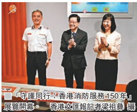
「守護同行：香港消防服務150年」展覽開幕。