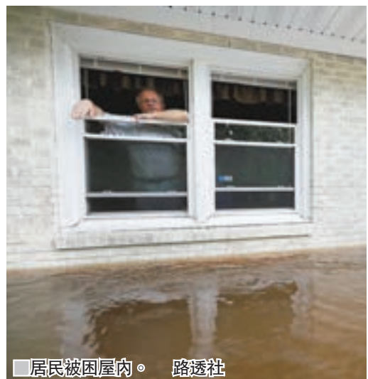
居民被困屋內。

電力公司杜克能源表示，威爾明頓市一間發電廠的煤灰堆填區在大雨下倒塌，洩漏約1,530立方米含有毒重金屬的煤灰，可能流入發電廠冷卻池，但估計不會危害人體健康或破壞環境。 ■綜合報道