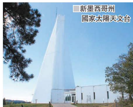
■新墨西哥州國家太陽天文台

工作人員匆匆鎖上辦公室離開，網民形容事件極不尋常，仿如1990年代科幻劇集《X檔案》般神秘。被問及關閉天文台原因時，FBI表示應查詢大學天文研究協會，協會則稱正與當局合作處理。管理天文台的研究人員於電郵中透露，將由協會決定何時重開天文台。 ■路透社/美聯社