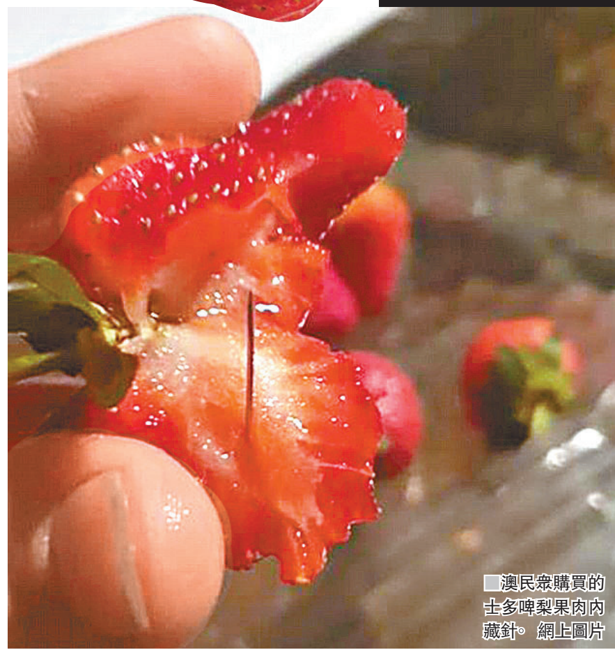
■澳民眾購買的士多啤梨果肉內藏針。

西澳省衛生部門發聲明，強調政府的安全警示只針對澳洲東岸地區，當局亦已擬訂進口限制，防止任何受影響產品進入西澳，當地生產的士多啤梨可安全食用，期望藉此解除公眾疑慮。 ■綜合報道