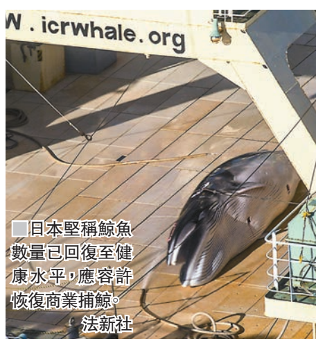
■日本堅稱鯨魚數量已回復至健康水平，應容許恢復商業捕鯨。法新社

IWC自1986年開始禁止商業捕鯨，日本卻以科研為由，每年捕獵最多333條鯨魚，近年更堅稱鯨魚數量已回復至健康水平，應容許恢復商業捕鯨。反對捕鯨國家認為，不少鯨魚品種的數量仍受威脅，商業捕鯨活動並非必要。澳洲代表蓋爾斯發言時表示，捕鯨並非關乎人權或食品安全，而是商業利益與環保之間的爭議。動物權益組織讚揚IWC拒絕日本的提案，指IWC堅決保護鯨魚，不會向日本不合理的捕鯨要求屈服。 ■法新社/美聯社