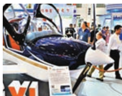
《人民日報》評論文章指,民營經濟只會壯大、不會離場。圖為GA20單發四座螺旋槳飛機,是具備完整知識產權的民營通用飛機。 中新社

香港文匯報訊 一篇建議民營經濟離場的新媒體文章近日引發熱議。文章認為「中國私營經濟已完成協助公有經濟發展的任務,應逐漸離場」。對此,《人民日報》新聞客戶端發表評論文章指,民營經濟只會壯大、不會離場。