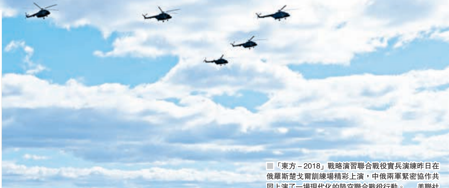
「東方—2018」戰略演習聯合戰役實兵演練昨日在俄羅斯楚戈爾訓練場精彩上演，中俄兩軍緊密協作共同上演了一場現代化的陸空聯合戰役行動。

香港文匯報訊 綜合新華社及俄羅斯衛星通訊社報道，地面鐵甲突進，空中戰機轟鳴。「東方—2018」戰略演習聯合戰役實兵演練昨日在俄羅斯楚戈爾訓練場精彩上演，中俄兩軍緊密協作共同上演了一場現代化的陸空聯合戰役行動。在隨後的沙場檢閱中，一系列重量級「明星」裝備悉數亮相，共同把這場規模空前的戰略演習推向高潮。俄羅斯總統普京現場全程觀看實兵實彈演練和沙場檢閱。中國國務委員兼國防部長魏鳳和率領中方觀摩團參加活動。