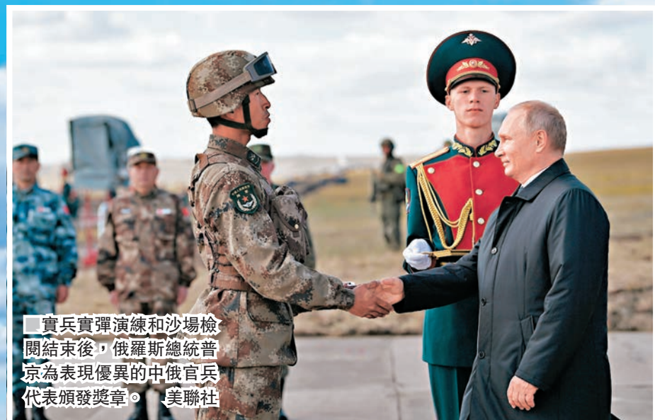
實兵實彈演練和沙場檢閱結束後，俄羅斯總統普京為表現優異的中俄官兵代表頒發獎章。