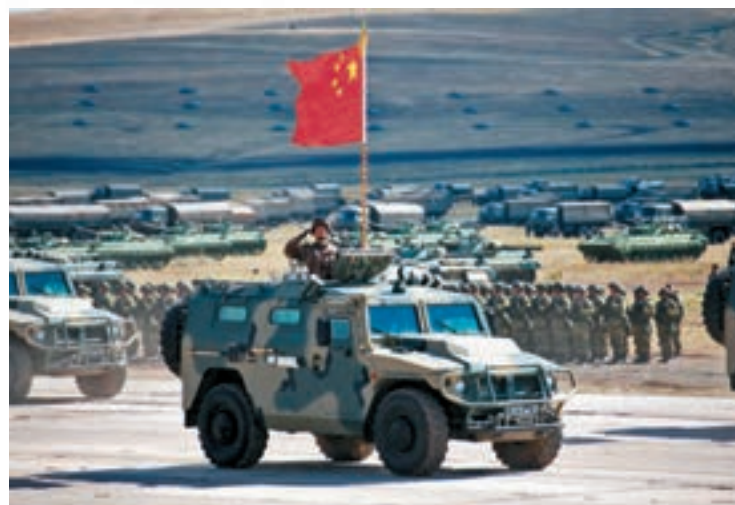
昨日，「東方—2018」戰略演習實兵演練結束後在俄羅斯楚戈爾訓練場進行沙場檢閱。圖為中方受閱部隊。中新社

香港文匯報訊 綜合新華社及俄羅斯衛星通訊社報道，地面鐵甲突進，空中戰機轟鳴。「東方—2018」戰略演習聯合戰役實兵演練昨日在俄羅斯楚戈爾訓練場精彩上演，中俄兩軍緊密協作共同上演了一場現代化的陸空聯合戰役行動。在隨後的沙場檢閱中，一系列重量級「明星」裝備悉數亮相，共同把這場規模空前的戰略演習推向高潮。俄羅斯總統普京現場全程觀看實兵實彈演練和沙場檢閱。中國國務委員兼國防部長魏鳳和率領中方觀摩團參加活動。