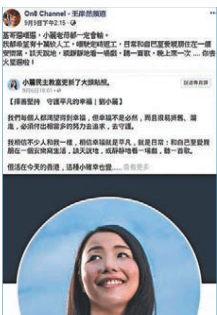
岸伯寸小麗老千啲文宣離地程度直達火星。

正所謂「人唔笑狗都吠」，見到小麗老千嘅最新出千伎倆，連見盡風浪嘅岸伯都頂唔緊，係b度發炮，話從張宣傳照嘅設計，已經睇出有樓嘢手嘅小麗老千係離地中產，「形象呢家嘢，可謂相由心生，你係什麼（麼）階級，就自然有什麼（麼）口味，裝扮可以騙人於一時，終於會露出本來面目。」