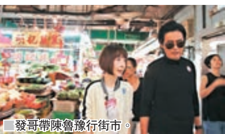
發哥帶陳魯豫行街市。

香港文匯報訊 正在香港忙於宣傳電影《無雙》的周潤發，日前接受鳳凰衛視《魯豫有約：說出你的故事》專訪。主持人陳魯豫特地來港一天與發哥上飛鵝山遠足，乘搭地鐵及天星小輪，亦到九龍城品嚐地道美食，帶觀眾感受發哥的日常生活。