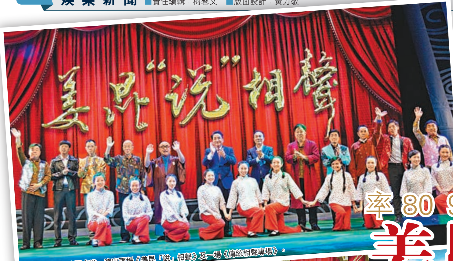
姜昆上周五率團來港，演出兩場《姜昆「說」相聲》及一場《傳統相聲專場》。