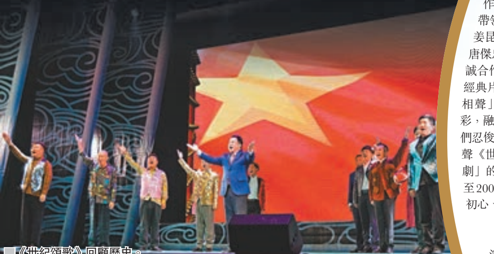
《世紀頌歌》回顧歷史。

演出以一段由年輕演員帶來的關於相聲的Rap視頻開場，隨即姜昆在與觀眾的互動中亮相，以一段單口相聲炒熱現場氣氛。與姜昆合作搭檔已25年的戴志誠此次客串主持，帶領觀眾回顧姜昆的40年藝術創作生涯，姜昆更深情回憶起自己與老搭檔李文華、唐傑忠等人在一起說相聲的情景，再與戴志誠合作再現首部大型相聲劇《明春曲》中的經典片段「環鬼子」。而在「和80、90後說相聲」的環節，幾位年輕演員同樣大放異彩，融合傳統相聲和當下的熱門話題，令觀眾們忍俊不禁。由姜昆率全體演員演出的群口相聲《世紀頌歌》同樣別具特色，借鑒「活報劇」的形式，在笑聲中帶領觀眾回憶1899年至2000年歷史畫面和時代巨變，發放「不忘初心、砥礪前行」的正能量。