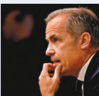
■ 卡尼延長任期至2020年。