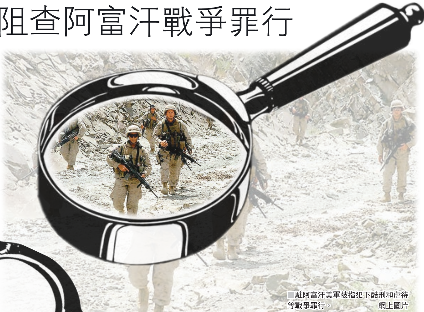
■ 駐阿富汗美軍被指犯下酷刑和虐待等戰爭罪行。