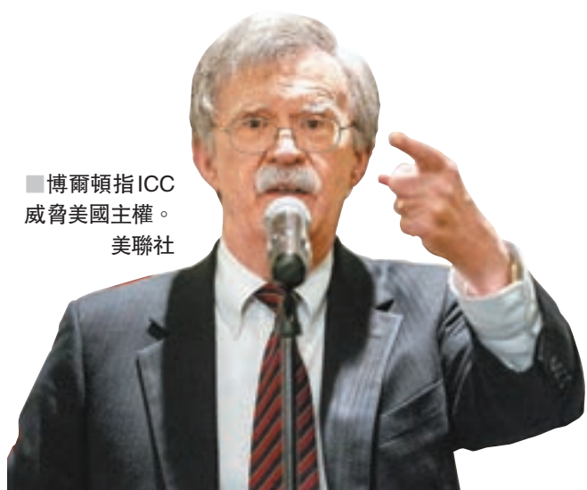
■ 博爾頓指ICC威脅美國主權。