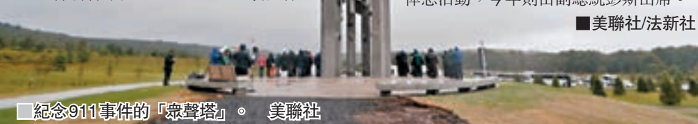
■ 紀念911事件的「眾聲塔」。