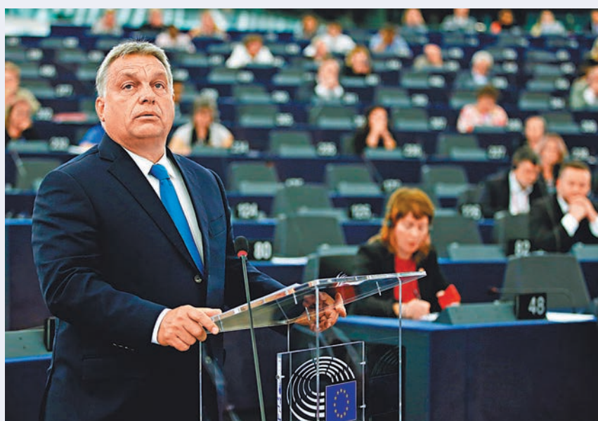
■ 歐爾班昨日到歐洲議會出席辯論，為匈牙利辯護。