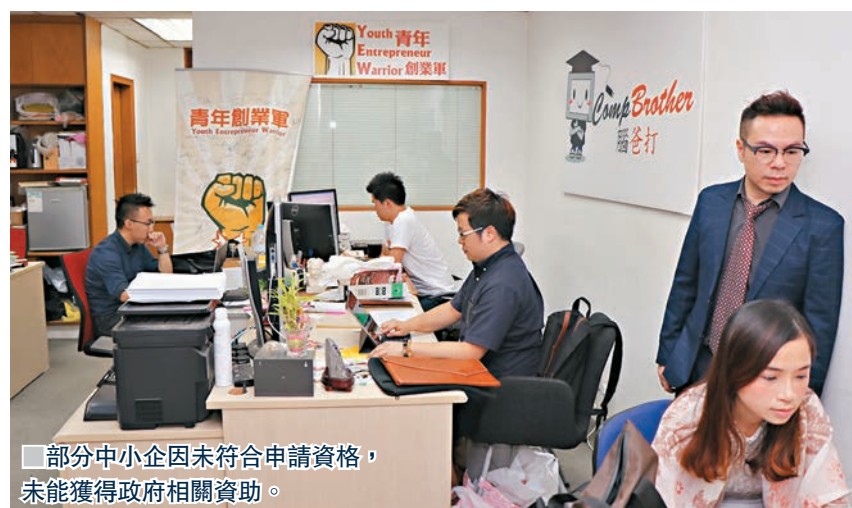
部分中小企因未符合申請資格,未能獲得政府相關資助。

公司背景同員工學歷,要睇吓佢係唔係可以畀研發方面支援到公司。」他相信這計劃的推出,有助推動本港的科研發展。