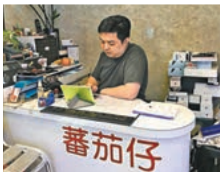
店主蕃茄指,近年市道較靜,未知蘋果新機能否「谷起」市道。