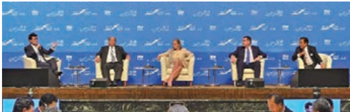
緬甸投資委員會主席當吞(左二)參加香港一帶一路全球論壇。