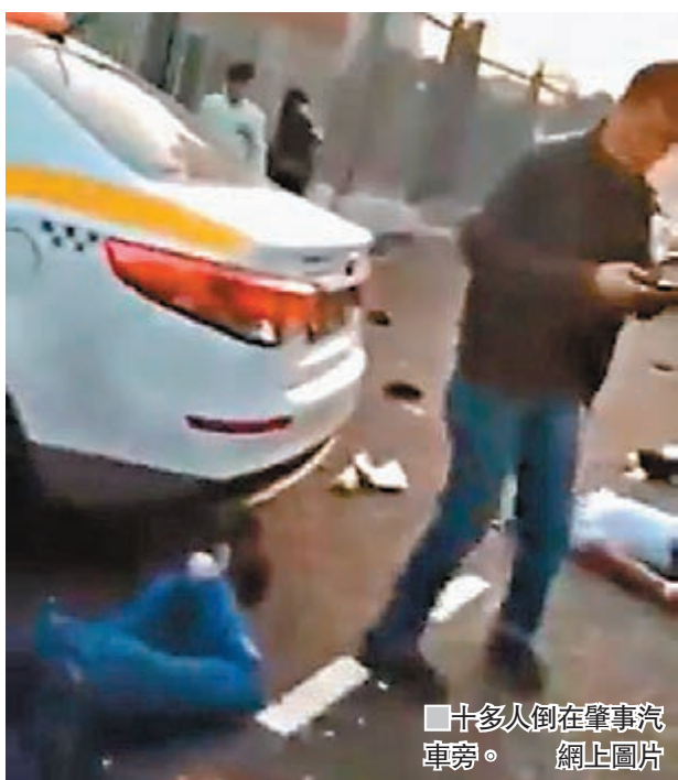
十多人在肇事汽車旁。

報道指，肇事司機事前曾經與一同行鄉爭吵，因此開車撞向他們。不過亦有報道指，事件並無蓄意成分，是肇事私家車失控導致。 ■綜合報道