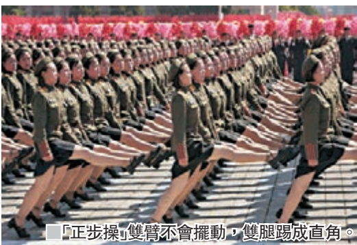
「正步操」雙臂不會擺動，雙腿踢成直角。

67歲脫北者沈氏曾就讀朝鮮頂級軍校日成政治大學，並以在校生身份參與1972年閱兵，他透露當時獲挑選踢正步的士兵，男的必須高1.65至1.74米，女的則要1.6至1.64米。脫北多年後，他現在即使獨處首爾街道，仍會幻想雨傘是步槍，筆直地步操，「我仍然感到自豪，朝鮮閱兵是全世界最好」。 ■美聯社