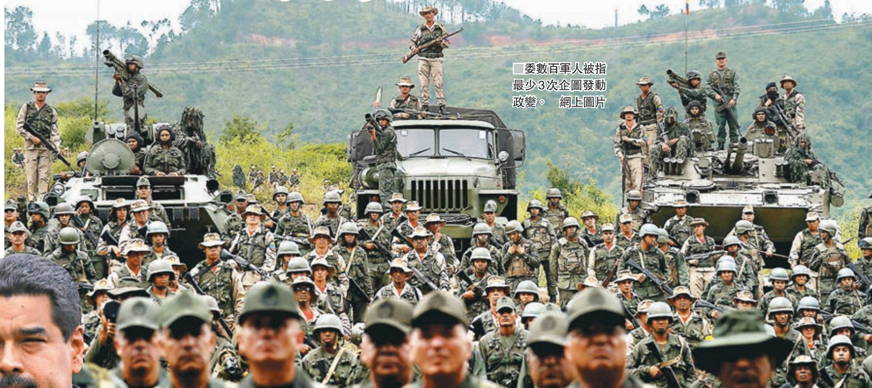
委數百軍人被指最少3次企圖發動政變。