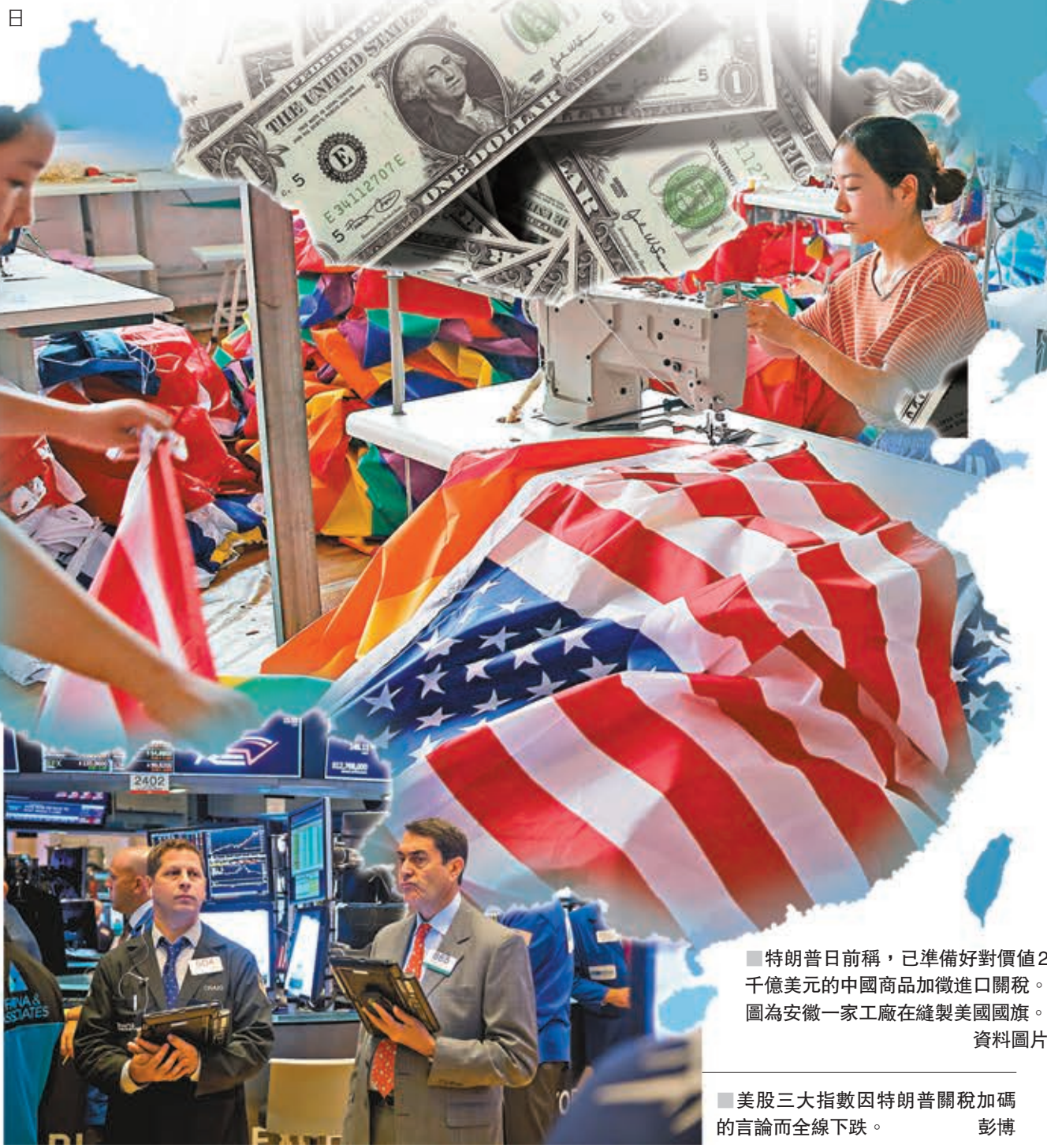
■ 特朗普日前稱,已準備好對價值2千億美元的中國商品加徵進口關稅。圖為安徽一家工廠在縫製美國國旗。

此前,中國財政部前日發文稱,為完善出口退稅政策,自2018年9月15日起對機電、文化等產品提高增值稅出口退稅率。同時,海關總署表示,埃塞俄比亞輪華大豆可正式向中國出口。白明指出,上述舉措將有助於中國在中美貿易戰中獲得主動。此外,中國也可以加強與歐盟、印度、日本等其他貿易夥伴的合作,在WTO規則範圍內,聯合反制美國的貿易單邊主義。