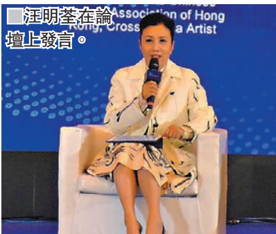
■ 汪明荃在論壇上發言。