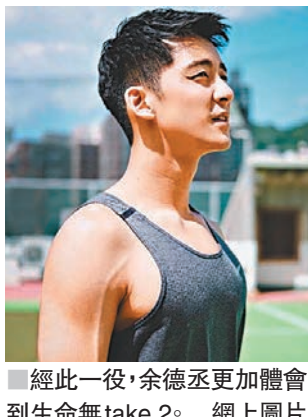
■ 經此一役，余德丞更加體會到生命無 take 2。