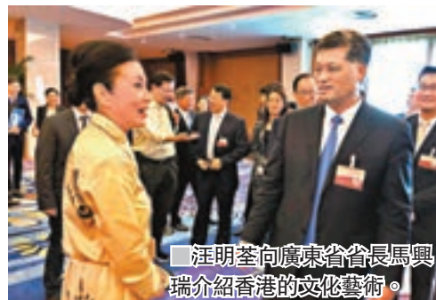
■ 汪明荃向廣東省省長馬興瑞介紹香港的文化藝術。