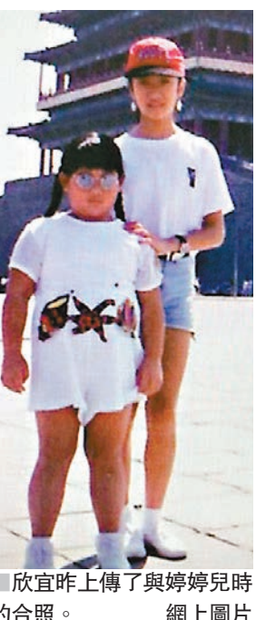
■ 欣宜昨上傳了與婷婷兒時的合照。