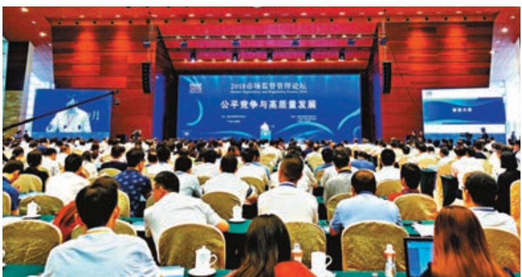
2018市場監督管理論壇廣東分論壇昨日在廣州舉行。

甘霖在主題演講中表示，粵港澳大灣區將成為中國對外開放的世界級門戶樞紐和「一帶一路」建設的重要橋樑。至於如何強化粵港澳市場監管深度合作，她認為可推進粵港澳商事登記、便利投資、藥品醫療器械、跨境消費維權、區域知識產權保護、競爭執法等多方面深度合作。同時落實放寬外商投資市場准入政策規定。甘霖指出，從地理區位看，廣東東接海峽西岸經濟區，北接長江經濟帶，西接北部灣經濟區，要建立和加強上述區域間市場監管協同機制，推動大灣區發展進一步輻射影響東南亞和南亞等地區。