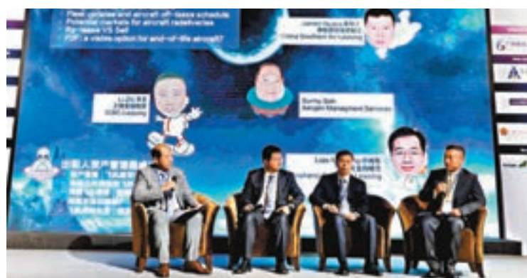
第四屆飛機資產再處置與交易管理專題論壇暨貨機與客改貨研討會5日至7日在廣州舉行。

香港文匯報訊(記者 帥誠 廣州報道)第四屆飛機資產再處置與交易管理專題論壇暨貨機與客改貨研討會日前在廣州舉行，會上公佈數據顯示，三年內南沙已累計引進租賃飛機73家，截至今年7月，南沙融資租賃企業數量達1,551家，註冊資金總額3,731億元人民幣。飛機租賃對高端服務、金融產業升級及專業人才等領域的產業鏈升級都起到促進作用，南沙已成為華南飛機租賃集聚中心。