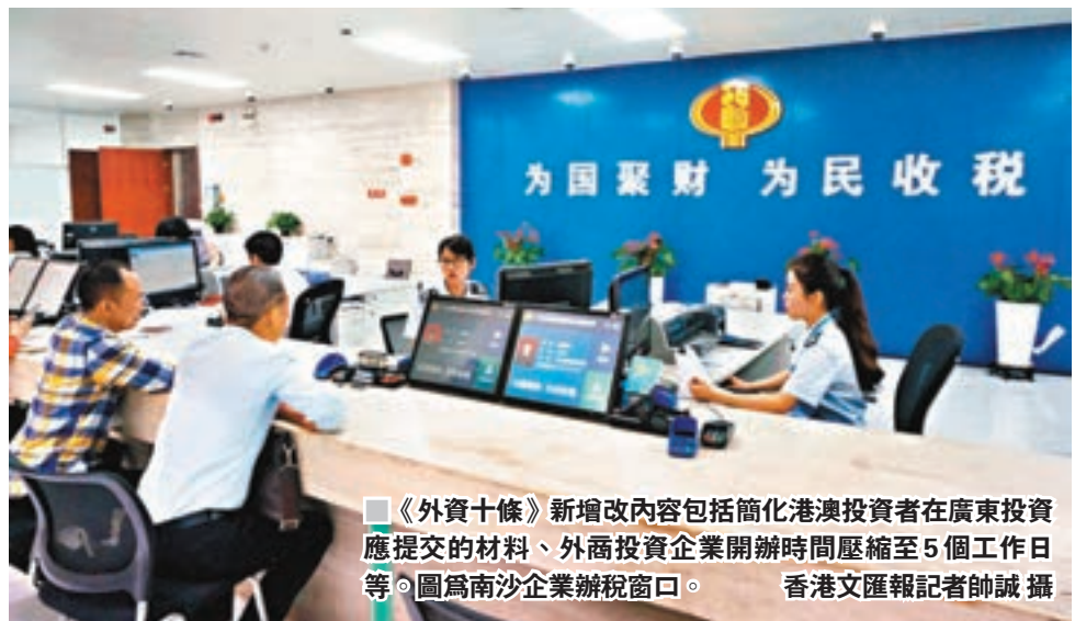
《外資十條》新增內容包括簡化港澳投資者在廣東投資應提交的材料、外商投資企業開辦時間壓縮至5個工作日等。圖為南沙企業辦稅窗口。

香港文匯報訊(記者 帥誠 廣州報道)廣東省政府日前發佈《廣東省進一步擴大對外開放積極利用外資若干政策措施(修訂版)》(下稱《外資十條》)。