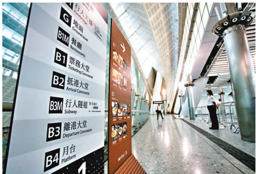
所謂「神秘樓層」，西九站指示牌其實早已標示。