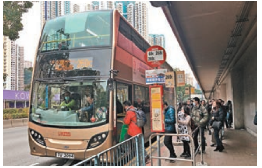
九巴龍運申請加價8.5%。

他又希望政府小心審批加價申請，以免帶起加風。新巴及城巴去年8月已向運輸署申請上調車費12%，以紓緩經營成本上升及乘客流失所帶來壓力，有關申請仍在處理中。