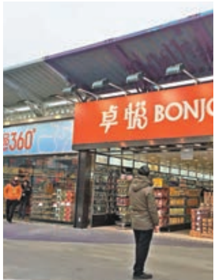
城規會開會審議新田商場續期申請。

香港文匯報訊(記者殷翔)由民建聯立法會議員黃定光牽頭、佔地420,000平方呎的「The Boxes新田購物城」，於2015年9月獲城規會批出3年短期規劃許可，將於今年9月18日到期。城規會昨日通過新田購物城續期申請，在附有帶條件下批給臨時性質的許可，為期3年。