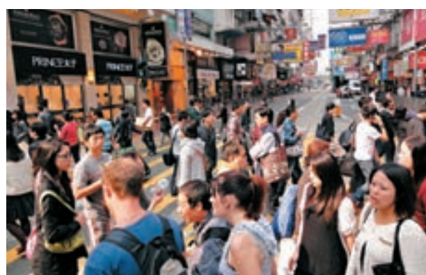
香港超越紐約,成為超級富豪最多的城市。資料圖片

雖然香港在各國城市中排名第一,且中國內地在各國中排名第三,但中國內地沒有一個城市擠進城市排行榜的前10名。這是因為中國內地的富人分佈廣泛,在30個超級富豪增加最快的城市中,26個都在中國。