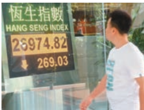
港股兩日跌千點,昨日跌市成交再增至1,053億元。

出現集體下跌,似乎說明港股已進入「無險可守」的境地,也就是到了新一波向下尋底的行情,料熊市將在短期內正式來臨。