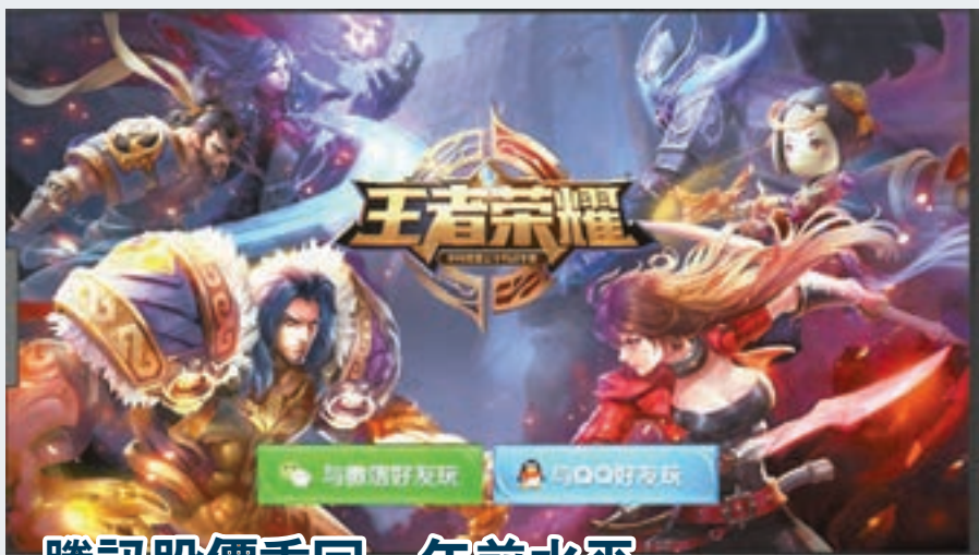
騰訊股價重回一年前水平

香港文匯報訊(記者周紹基)內地將進一步加強遊戲監管,騰訊(0700)旗下網遊《王者榮耀》的新用戶資料,將接入公安數據平台,以判斷用戶是否未成年人士,再決定是否將賬號納入防沉迷體系。此外,內地又傳會向所有的網絡遊戲,開徵35%的專項稅,並實行遊戲版號配額制,即每年在內地推出的遊戲需要有「配額」,消息令網遊收入佔很大部分的騰訊全日捱沽,盤中低見312元,收跌3.1%報314.6元,創一年新低,市值失守3萬億元大關,跌至29,957億元,一年蒸發約1.54萬億元,大跌34%