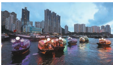
繽紛的彩艇將免費接載市民遊走香港仔避風塘。