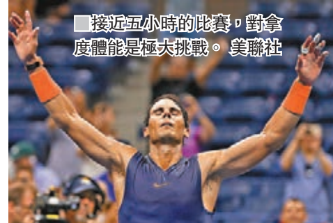
接近五小時的比賽, 對拿度體能是極大挑戰。美聯社

女單賽事, 細威以6:4和6:3淘汰比莉絲高娃, 衛冕冠軍3號種子史堤芬絲爆冷輸給了19號種子施維絲杜娃。 ■新華社