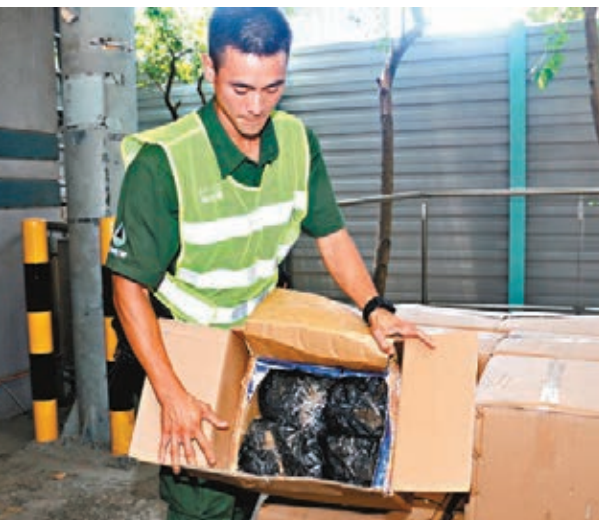
▲海關及漁護署在聯合記者會上，展示連月行動所檢獲的走私瀕危物種。