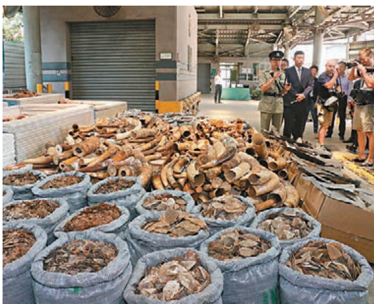
▲海關及漁護署在聯合記者會上，展示連月行動所檢獲的走私瀕危物種。

香港文匯報訊(記者 蕭景源) 走私瀕危物種非法活動急增，海關在今年首8個月已破獲案件達522宗，包括6月至8月期間與漁護署聯合展開的「守衛者」大型行動，數字較去年同期急升78%，拘捕人數較去年同期增加逾倍至374人，緝獲物品總重大升241%達174噸，總值5,860萬元，當中包括多種受管制的瀕危木材、動植物等。漁護署提醒，保護瀕危動植物修訂條例已在本年5月生效，罰則大幅度提升，任何人違法最高可被判囚10年、及罰款1,000萬元，市民切勿以身試法。