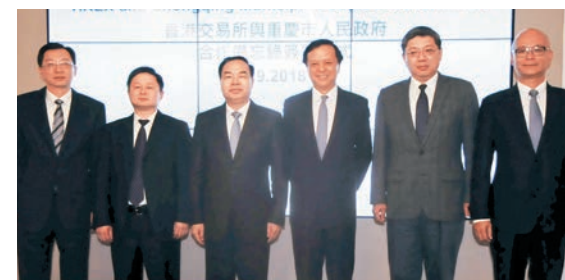
■重慶市長唐良智(左三)稱，港交所促進內地企業在港上市是對內地經濟很大支持。

香港文匯報訊(記者韓毅)重慶代表團近期來港招商推介，重慶市長唐良智一行昨日會見香港交易所集團行政總裁李小加。港交所與重慶市人民政府簽署合作備忘錄，旨在促進渝港資本市場合作，推進雙方企業和機構開展跨境投融資活動，推動重慶企業和機構加快在港資本市場融資、跨境發展。按照該市計劃，及至2022年底，當地將實現境內外上市公司數量倍增目標，新增境內外上市公司70家，達到140家。港交所今次與重慶市政府簽署合作備忘錄主要內容包括：建立高層交流機制、探討雙方資本市場互聯互通的可能性、支持重慶企業上市、支持港交所參與重慶市交易所發展合作、支持港交所與江北嘴濱江中心合作、開展人才交流、加強信息共享和研究互動。此前，重慶市金融辦與香港中資證券協會簽署合作諒解備忘錄，香港中資證券協會將為重慶企業及重點項目創建與各類金融機構對接、洽談、交流的平台，為企業構建與香港資本市場對接的融資渠道，為重慶發展提供融資服務。