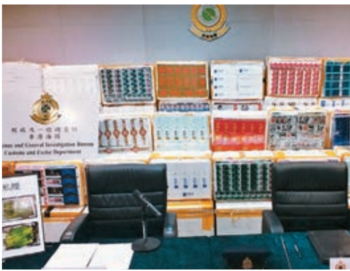
■入境貨車藏走私煙140萬支。

香港文匯報訊(記者 蕭景源、鄧偉明)本周日(2日)海關在文錦渡管制站截獲一輛報稱運載蔬菜的入境貨車時,因發現藏有蔬菜的發泡膠箱重量不一,懷疑下作X光機掃描檢查,揭發以蔬菜作掩飾走私煙案件,檢獲約140萬支私煙,估計市值約380萬元,應課稅值約260萬元,當場拘捕60歲司機帶署扣查。海關稅收及一般調查科私煙調查第一組指揮官陳啟豪表示,檢獲的私煙在發泡膠箱外已寫有標記,相信是早已分門別類,方便在運抵港後馬上分發給拆家,部分走私煙印有政府健康忠告標語,海關正調查該批走私煙的包裝真偽、來源及分發地,正追緝幕後主腦及在逃同黨下落。