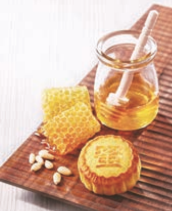
■ 奇華餅家松子蜂蜜奶皇月

奇華餅家灣仔特色旗艦店特設開放式現烤廚房，每天即時焗製多款港式餅食，香氣瀰漫整間店舖，一直深受市民及上班族歡迎。除了提供多款精選港式餅食，由即日起更會推出新鮮焗製的奶皇月餅。為滿足各位「奶皇月」迷，奇華餅家灣仔特色旗艦店由即日起連續三個星期五，推出「現烤奶皇月買一送一限定激賞優惠」。