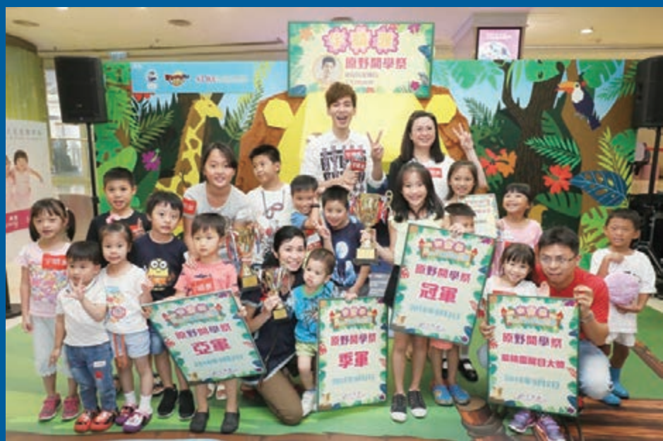
■ 林奕匡與一眾參賽小朋友及評判合照留念

開學前夕，長江實業旗下商場向大家發放正能量，為迎接新學年的學生們打氣。荔枝角宇晴滙日前舉行「原野開學祭」活動，為大家準備一系列以開學為主題的競技遊戲。