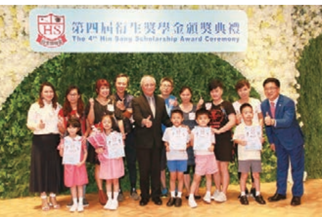
■ 頒獎嘉賓吳克儉與得獎同學合照

「衍生獎學金」由衍生集團於2015年設立，旨在獎勵及資助成績優異及才藝出眾的學生，以生命影響生命。第四屆「衍生獎學金」資助範圍涵蓋幼稚園組、小學組、中學組及大學組，經遴選後選出65名得獎學生，日前舉行了「第四屆衍生獎學金頒獎典禮」，各界人士親臨出席，包括資深教育界人士、商界名人、演藝人，為得獎學生送上支持。