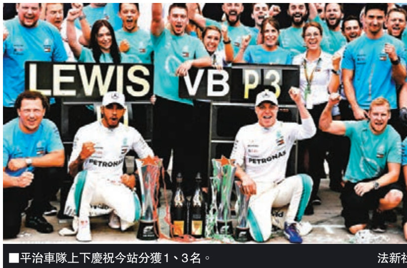
■平治車隊上下慶祝今站分獲1、3名。

平治車隊的4屆世界冠軍車手咸美頓，於本港時間周日晚上舉行的一級方程式意大利站賽事，以總時間1小時16分54.484秒獲勝，賽後領先主要對手、法拉利車隊的維度爾30分。 今場比賽的勝負分野，主要在比賽初段排第3位起步的咸美頓，想在外線超越排第2起步的維度爾時，雙方發生碰撞，並令維度爾戰車跌至尾列。賽後，兩位車手就各執一詞，其中維度爾就表示：「大家從鏡頭該可看到，咸美頓在外線上來時，沒有給我留下足夠空間，所以碰撞是無可避免的事。」 相反地，咸美頓自然指自己的舉動沒有問題：「我有點訝異維度爾選擇內線，那只會給予我上前機會；而我已經確係離開他足夠距離，相信他是鎖死了輪胎才撞我。」今戰之後，咸美頓在車手榜獲得256分，領先維度爾有30分之多。 ■綜合外電