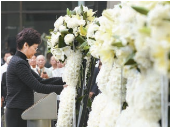
▲林鄭月娥獻上花圈。